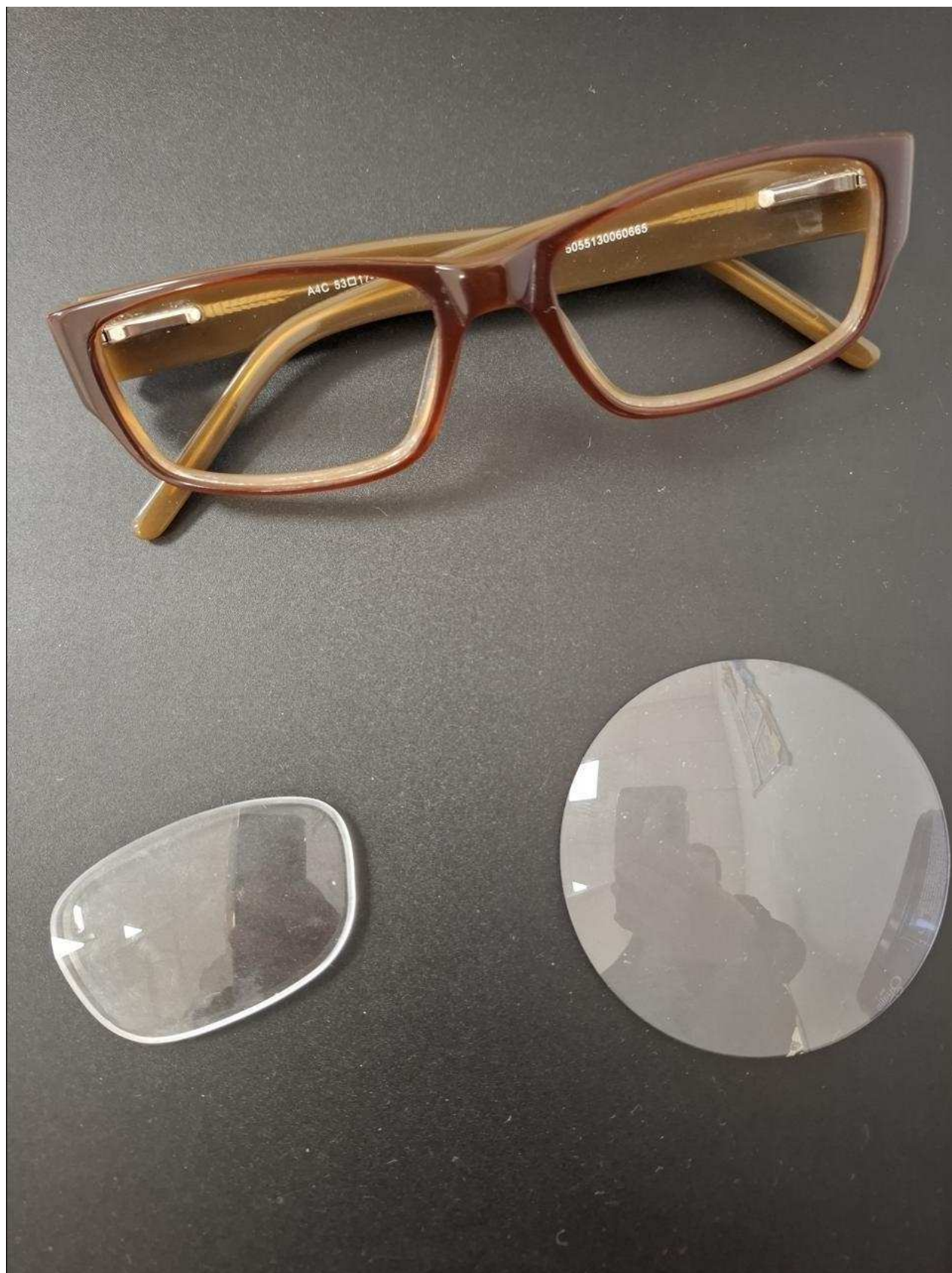
En haut, un verre de lunettes. En bas, le galet dans le verre a été taillé. Ouest-France