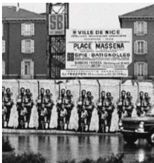
Apartheid en Afrique du Sud (1974) D.R.