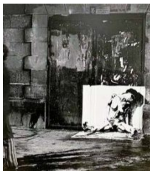
L'avortement (1971) en relation avec le roman d'Annie Ernaux