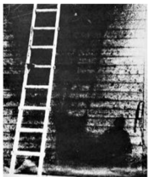
Plateau d'Albion (1966) à propos de la bombe atomique