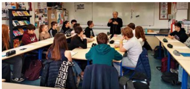
Des échanges passionnants entre Ernest Pignon-Ernest et les élèves G.F.

A l'évidence, les élèves connaissaient la biographie de l'artiste plasticien et avaient étudié quatre de ses œuvres dans le cadre du PEAC (Parcours d'éducation artistique et culturelle)