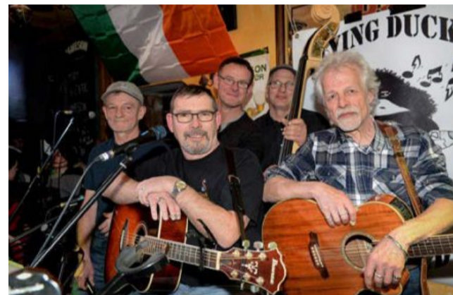
Et en avant la musique folk irlandaise FRL