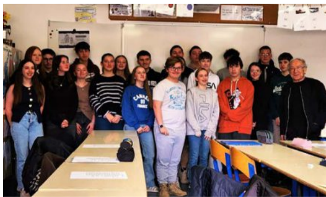
Cette rencontre restera dans toutes les mémoires G.F.

« Quelle belle leçon d'humilité, de générosité et d'hu-