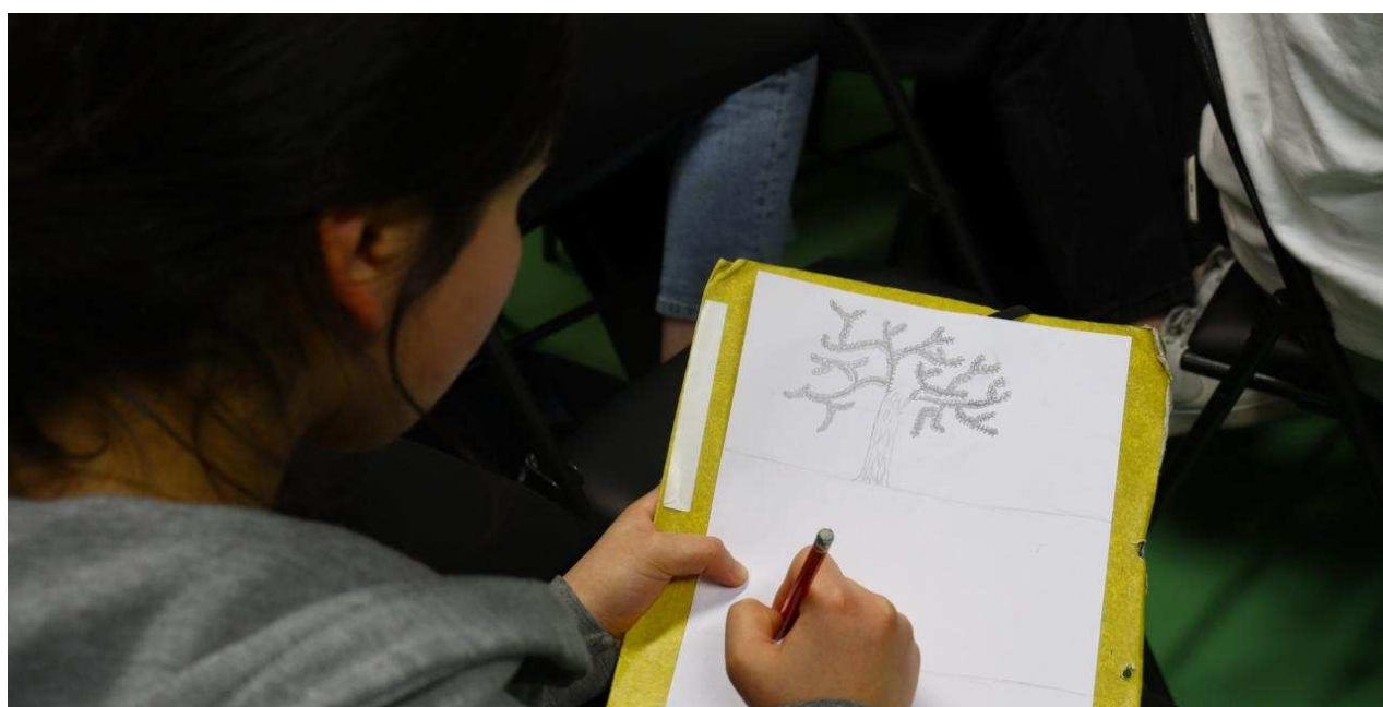
Les élèves du collège Dolto ont pu s'essayer à la création d'un story-board