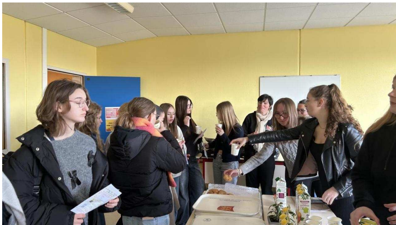
Un goûter convivial était organisé par les élèves du lycée Pablo Neruda.

Lors de la prise de fonction de Sophie Hébert en 2021, les effectifs féminins représentaient une part de 11 % de l'établissement. Un taux qui fortement augmenté en 2024 pour atteindre 27 %. La barre des 20 % a de nouveau été franchie pour la rentrée 2025. « Au-delà de cette communication, c'est toute une manière de penser qui a été renouvelée, notre site Internet et nos plaquettes sont rédigés avec l'écriture inclusive qui est obligatoire. On a appliqué toute une mode non-genrée pour les services administratifs », distille la proviseure. « On veut surtout insister sur l'équité », ajoute-t-elle. 230 collégiennes ont participé à cette Girl's Day, un chiffre en hausse par rapport aux deux premières éditions, qui ont respectivement accueilli 181 et 220 élèves.