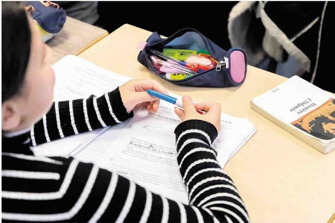
Au collège Pierre-de-Ronsard, à L'Haÿ-les-Roses (Val-de-Marne), le 12 novembre 2024.

Outre ceux qui n'ont pas du tout appliqué la réforme, une grande partie des collèges a adapté la mesure