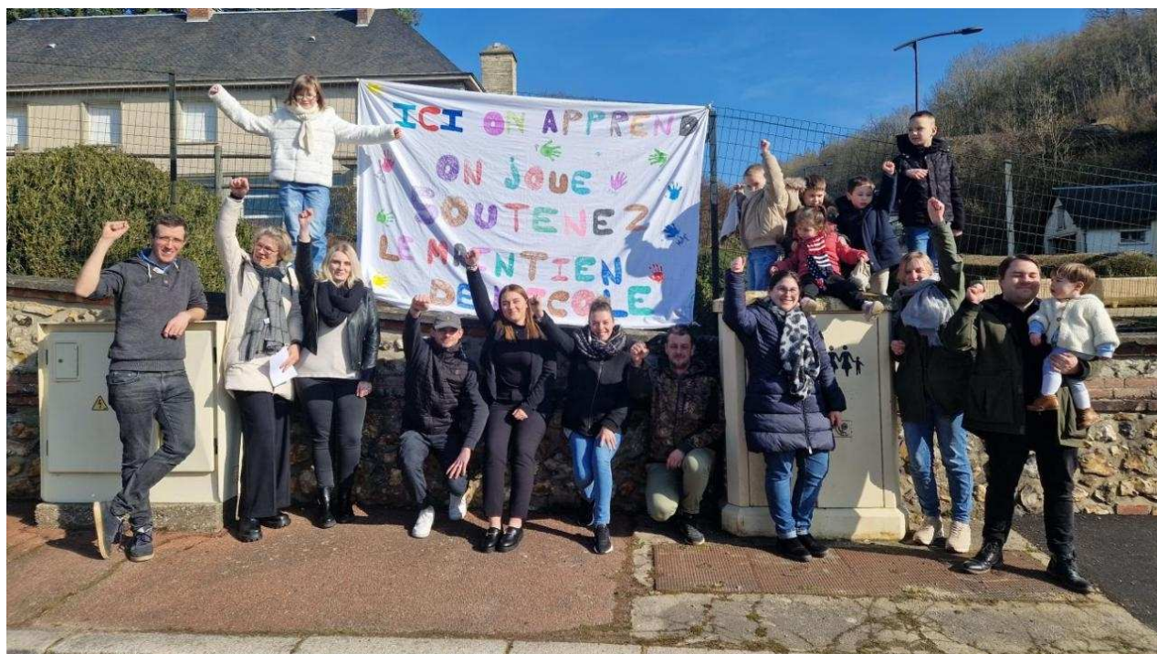
Les parents d'élèves de l'école de Beaumontel luttent contre sa fermeture

Les parents d'élèves de l'école de Beaumontel , menacée de fermeture à la rentrée 2025, luttent pour défendre cet établissement scolaire local. Ils ont créé une pétition en ligne et participeront à une manifestation à Évreux , le 4 mars.