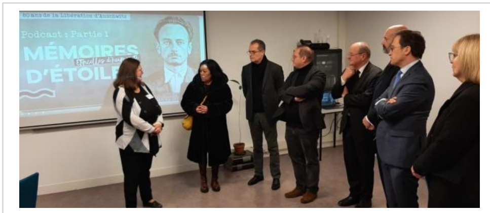
Les élèves du lycée Marc-Bloch ont travaillé sur le livret de l'exposition Mémoires d'étoiles, étincelles d'humanité ainsi que sur un podcast sur la Shoah.