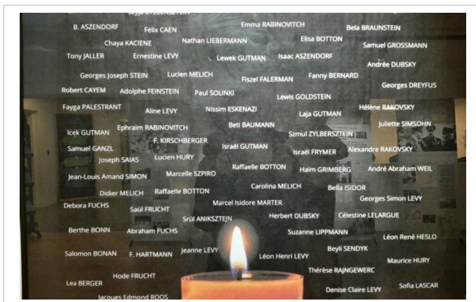
Le nom des Juifs de l'Eure morts en déportation inscrits sur une plaque.