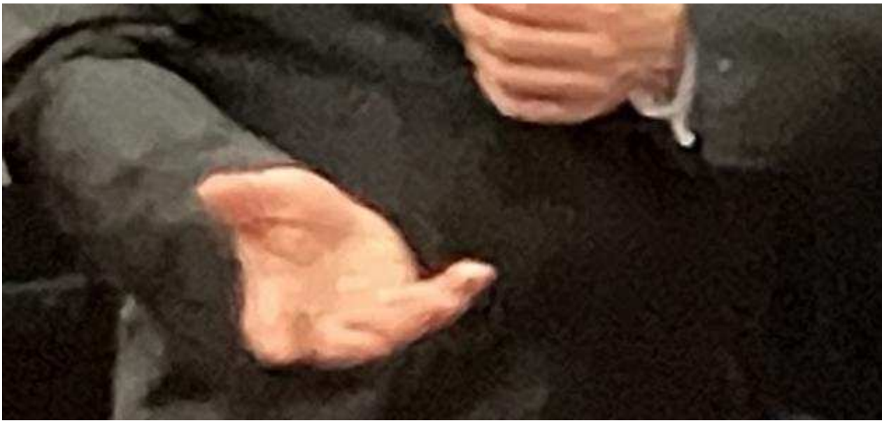
Le Ténor Di Bettino.