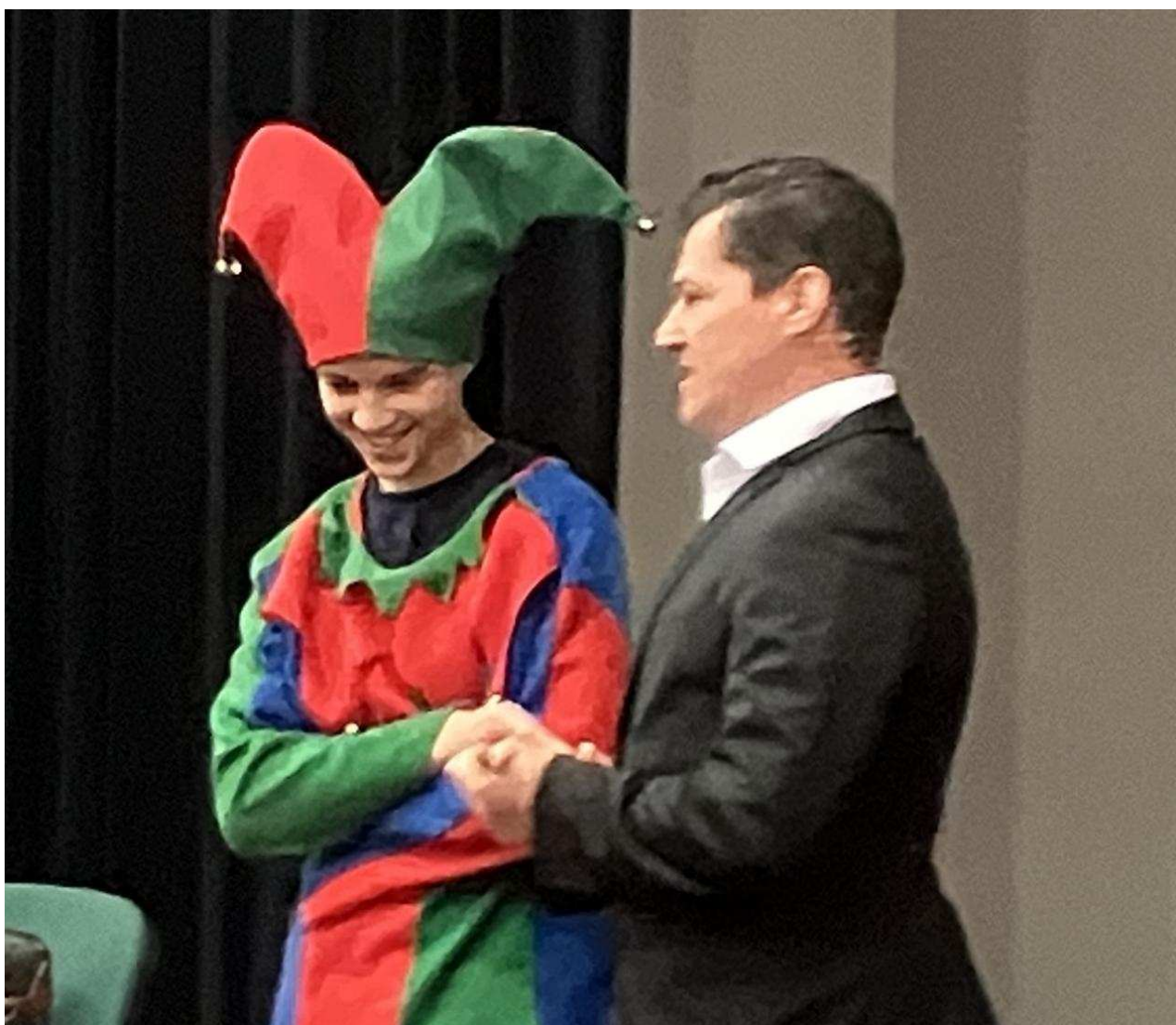
Le Ténor di Bettino a permis à un élève d'être figurant.