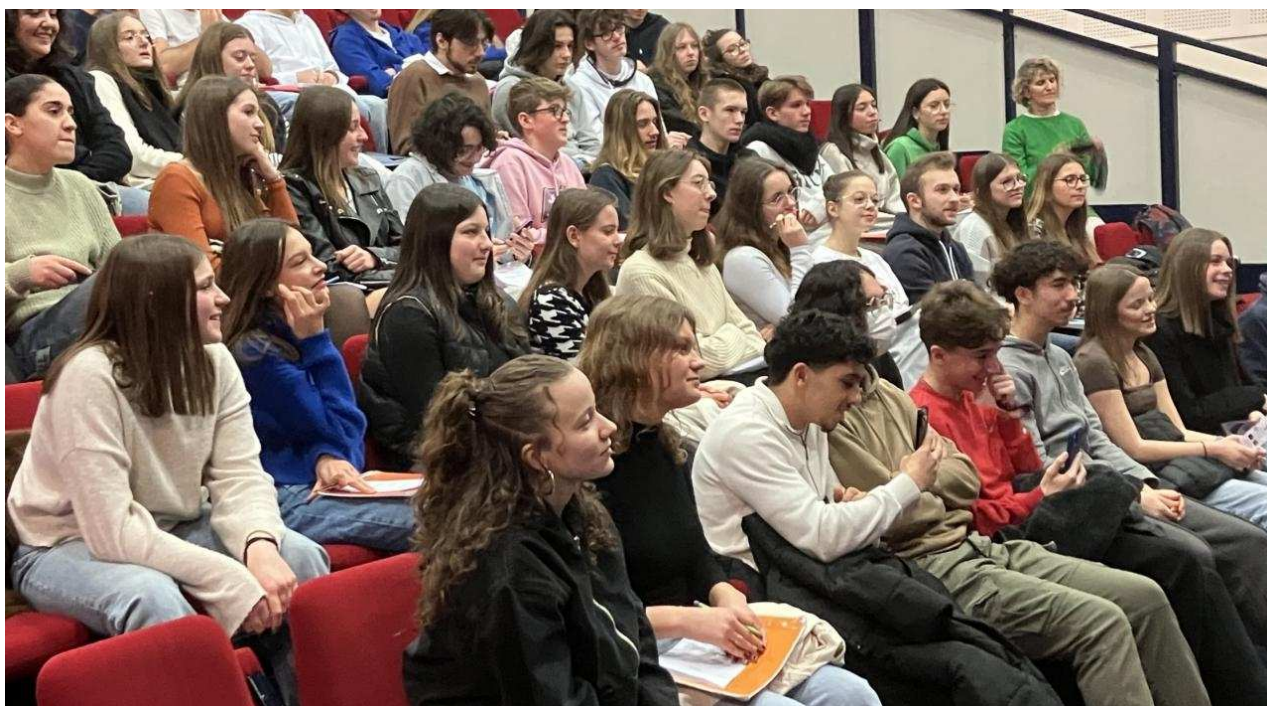
Les lycéens à l'écoute.