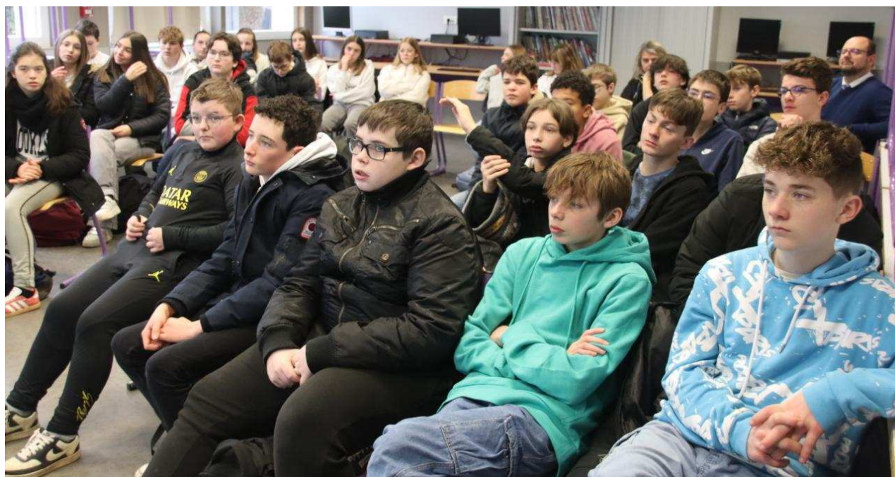
Les collégiens de 4e.