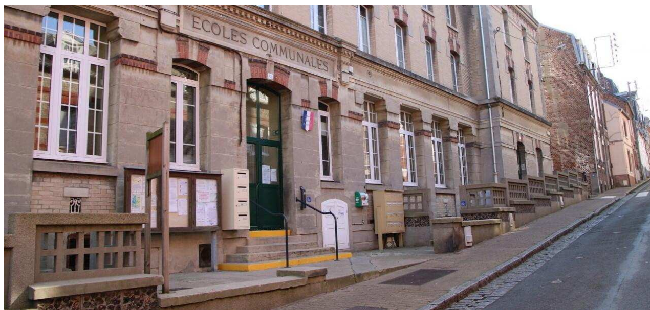
L'école LDM au Tréport.