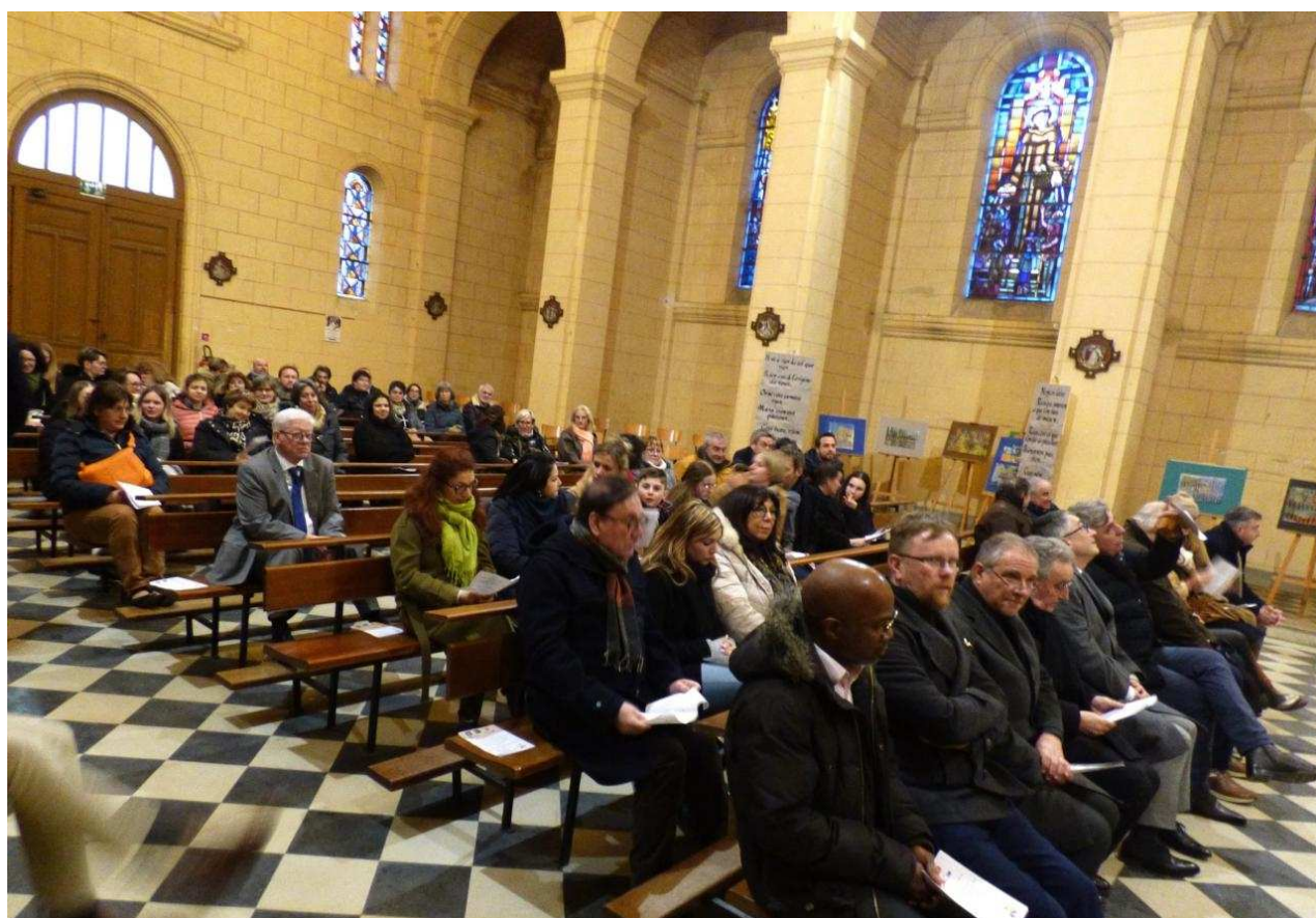
Le public réuni dans la chapelle

De notre correspondant, Jean-Noël Magrez