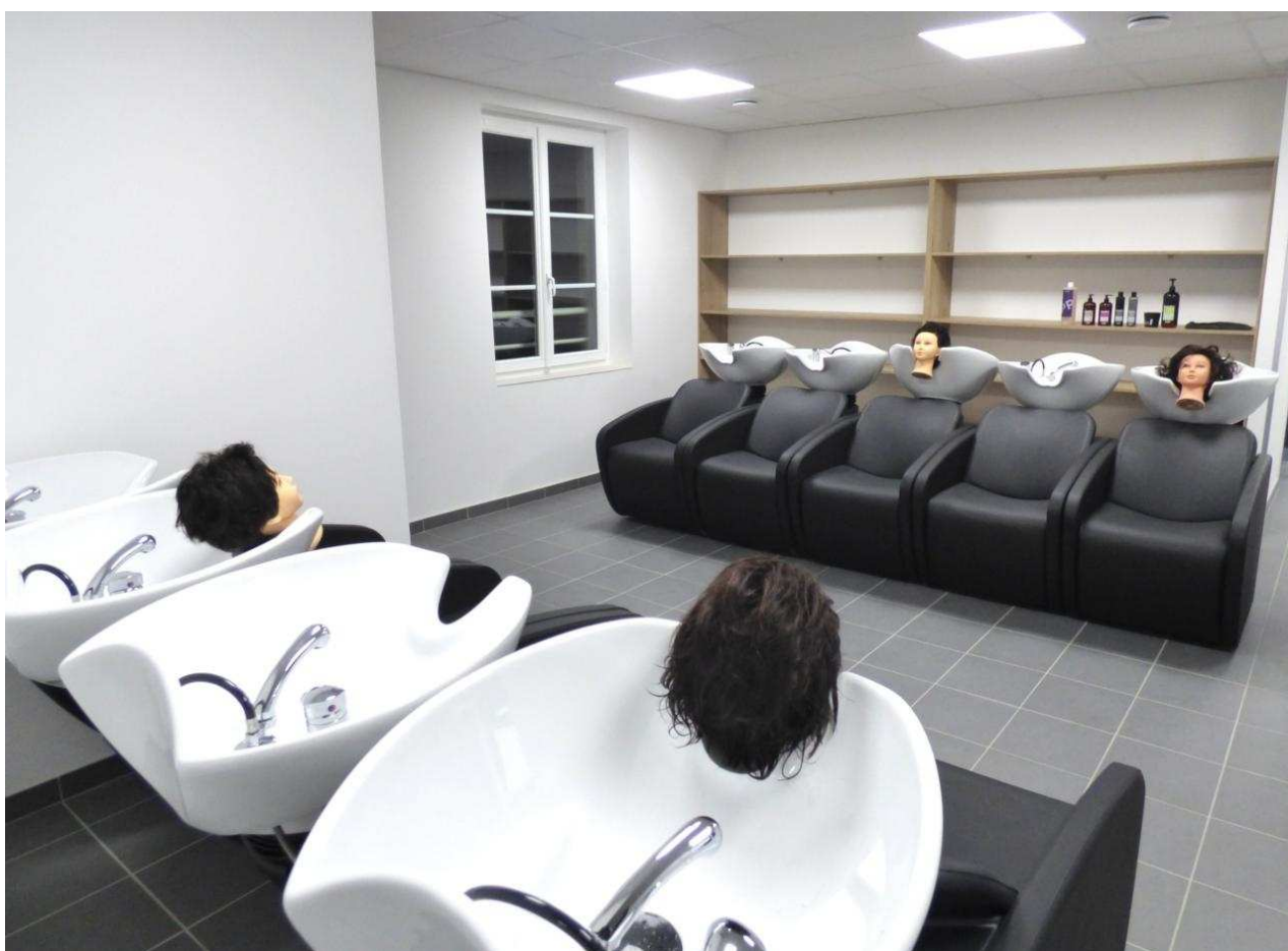
Vue d'une salle du pôle coiffure qui sera mise en service le mois prochain.