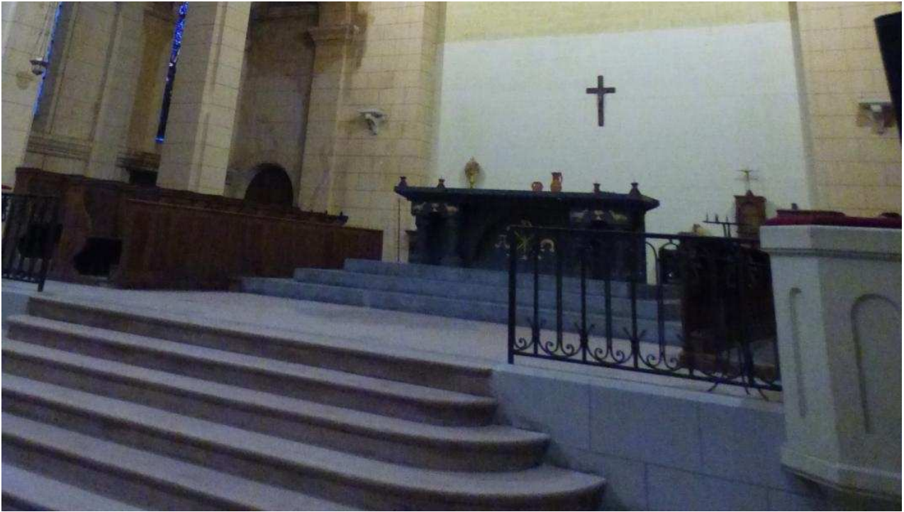
Vue de l'intérieur de la chapelle.