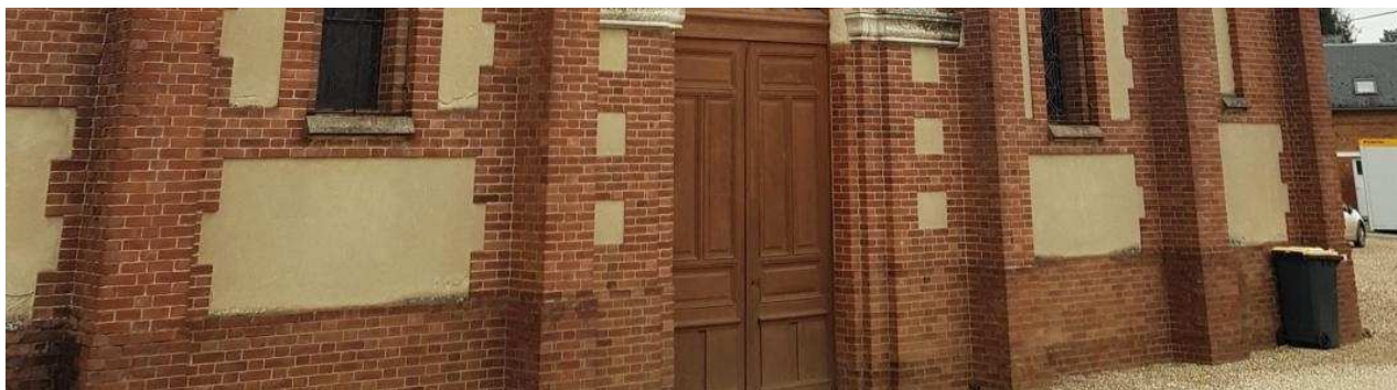
La façade de la chapelle.