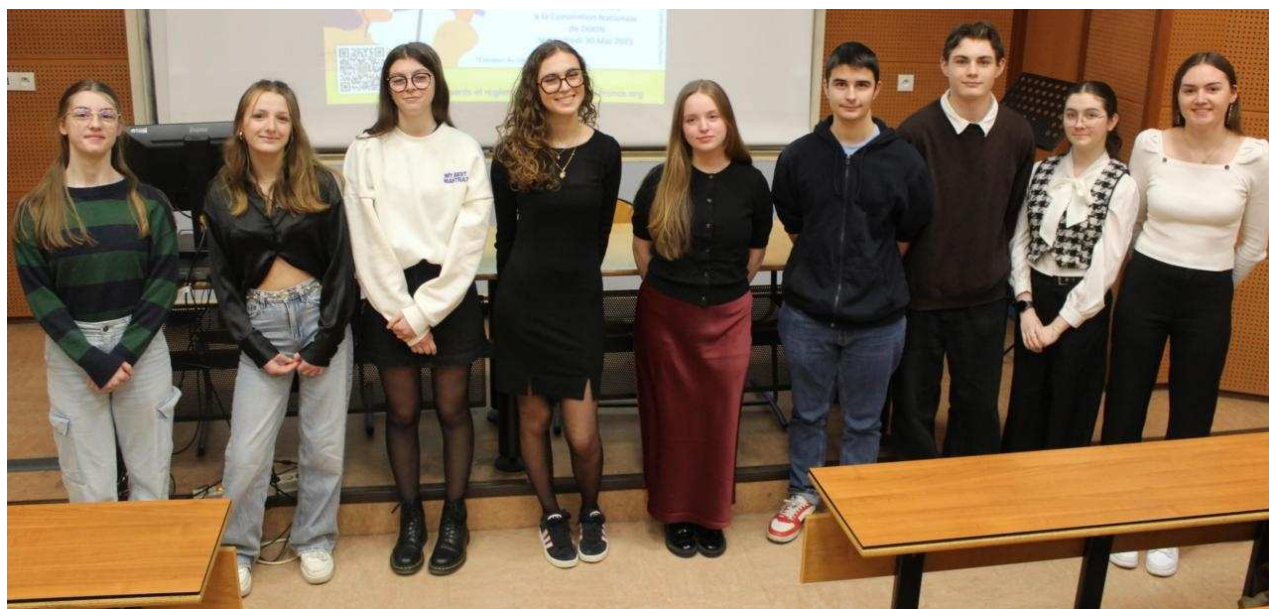
Les candidats du concours d'éloquence. CM