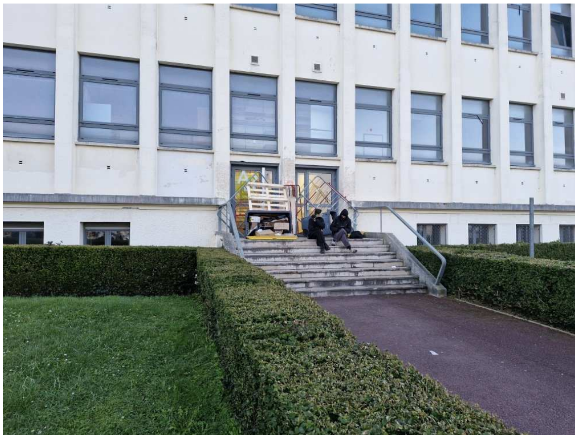
Quelques étudiants tiennent les barrages.