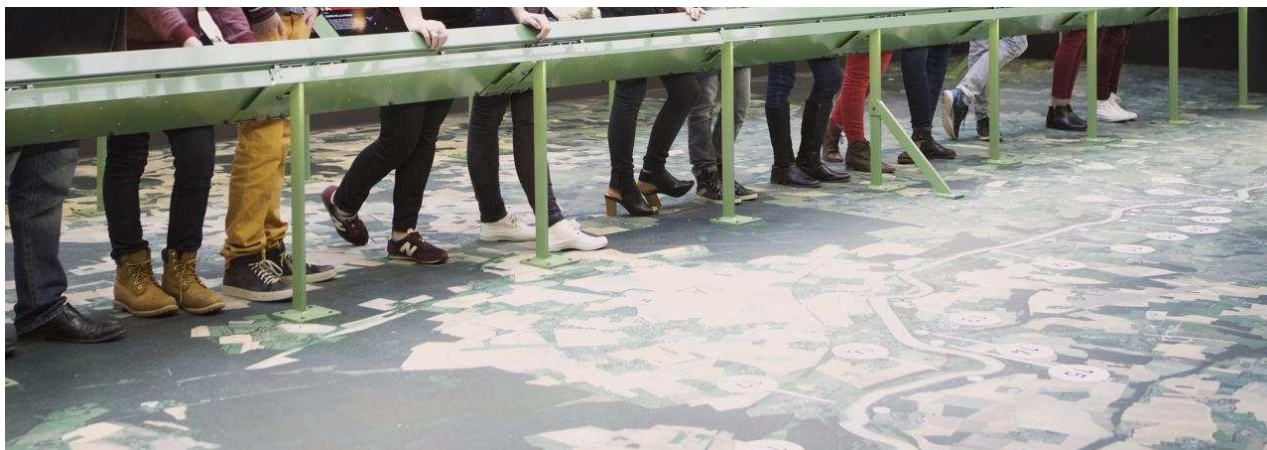
Une visite de scolaires à l'usine Bohin en 2015