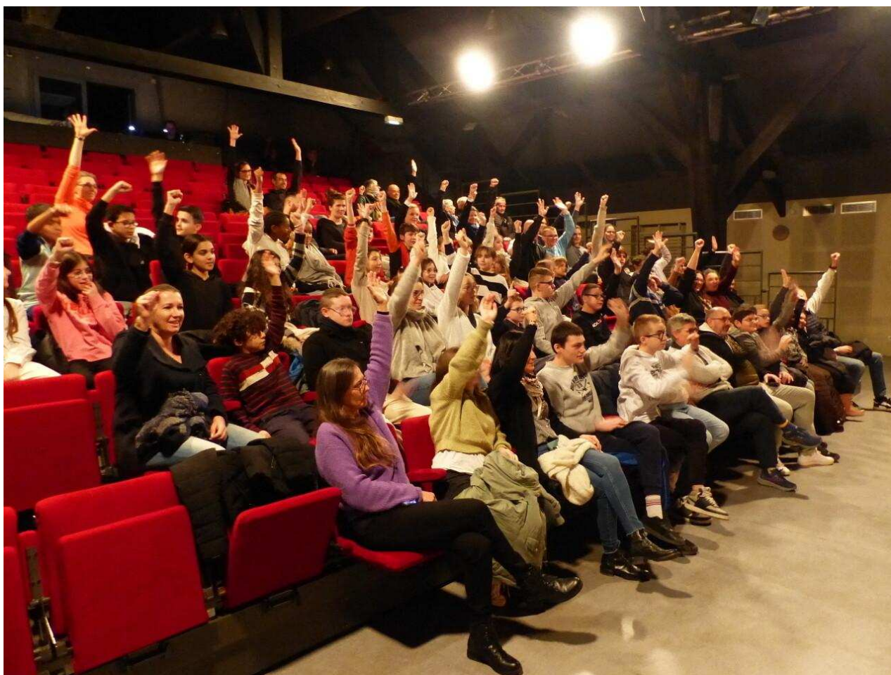
Un public sans concession.

Le public ne dira pas le contraire. Composé d'impitoyables amis, parents, et grands-parents, il ne boude pas le rôle de juge qui lui est assigné, à la manière des jeux de la Rome antique.