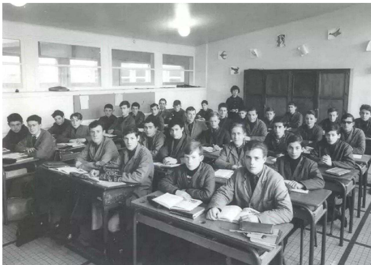
1955 : les 3e A du collège Letot.