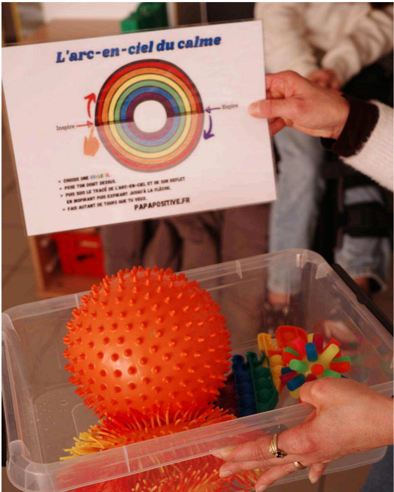
Le Neubourg - Unité externalisée d'enseignement - école Dupont-de-l'Eure Simon Lenormand