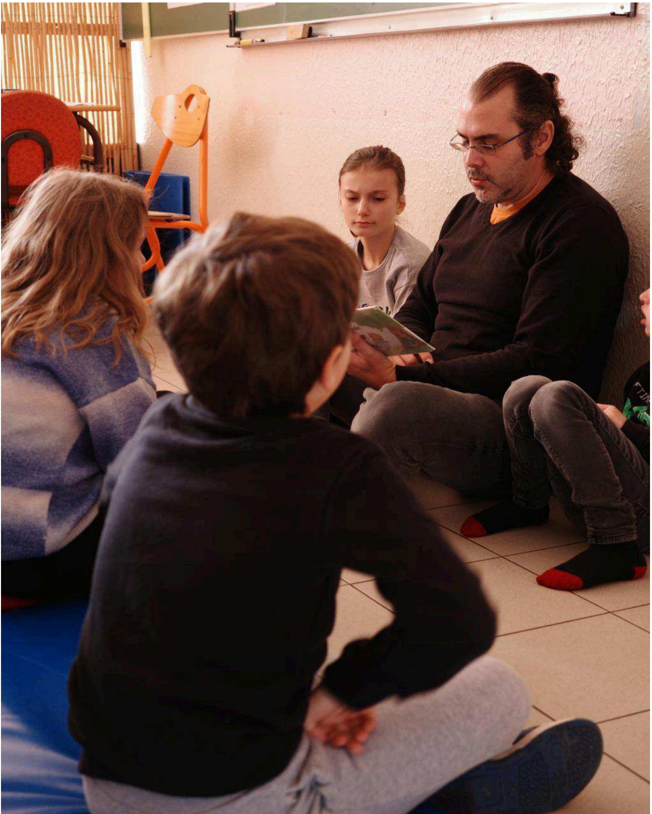
Le Neubourg - Unité externalisée d'enseignement - école Dupont-de-l'Eure Simon Lenormand