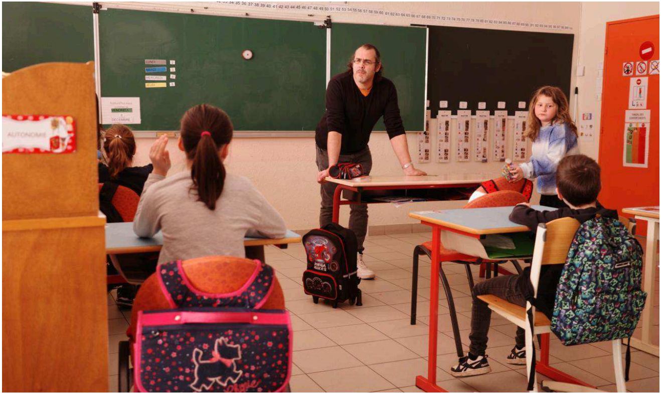
Le Neubourg - Unité externalisée d'enseignement - école Dupont-de-l'Eure Simon Lenormand