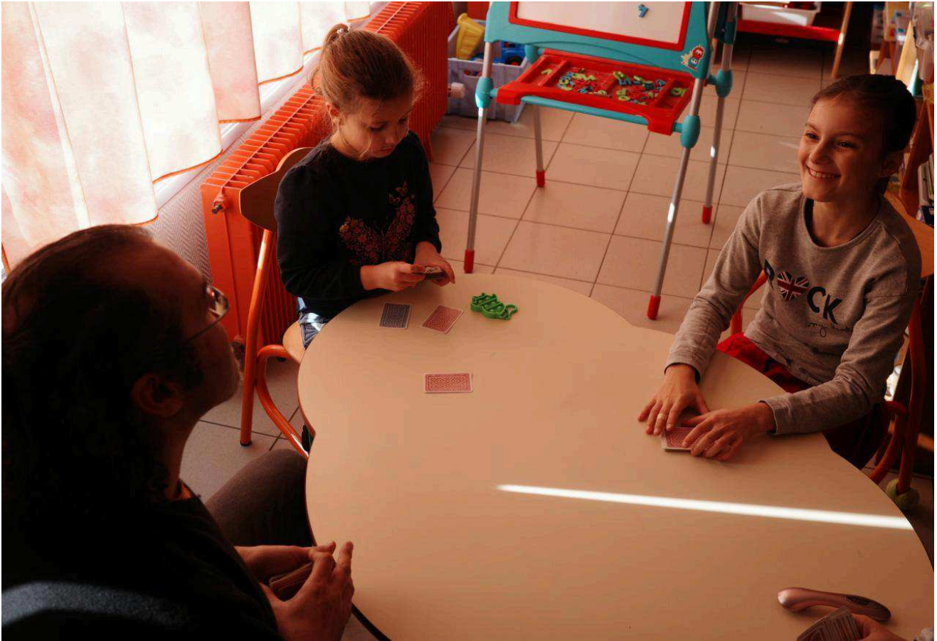
Une table est dédiée aux jeux des enfants, en groupe ou en autonomie. SL