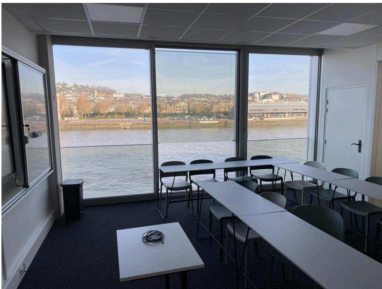
Le campus compte plusieurs salles ouvertes dont certaines avec vue sur la Seine.

"Les trois premières années seront consacrées à l'acquisition des fondamentaux, dans les différents aspects du métier de journaliste : presse écrite, web, radio, etc, explique Ludivine Delahais, directrice du campus rouennais. Les degrés suivants, M1 et M2, seront ouverts à partir de l'année suivante, en 2026, avec des spécialisations et la possibilité de suivre le cursus en alternance."