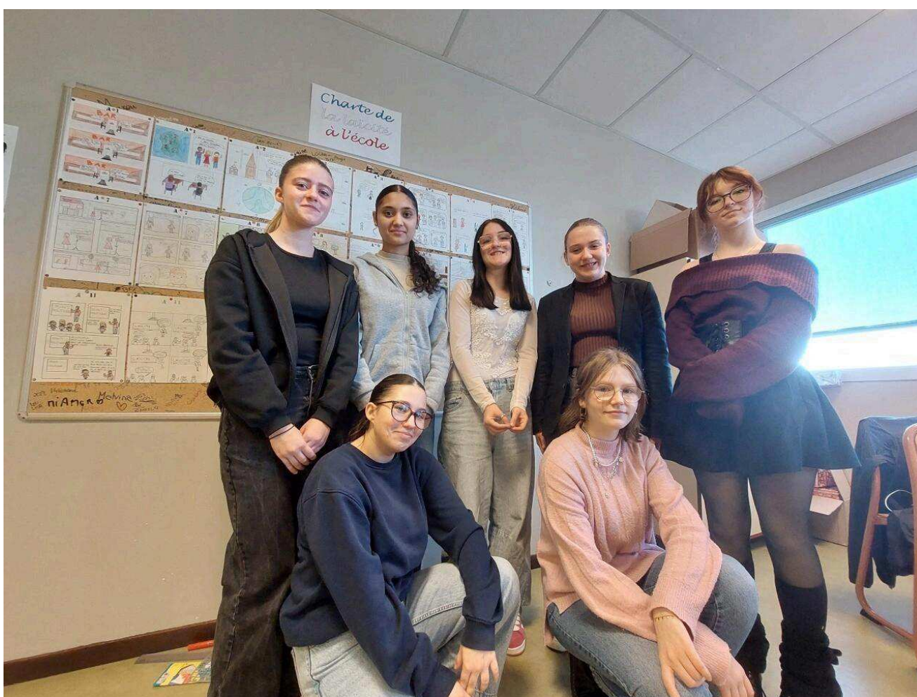
Les élèves ont travaillé sur la charte de la laïcité à l'école.

Le bien vivre ensemble, dans le respect des différences, était la thématique d'une semaine consacrée aux grands principes de la laïcité au lycée du Pays de Bray.