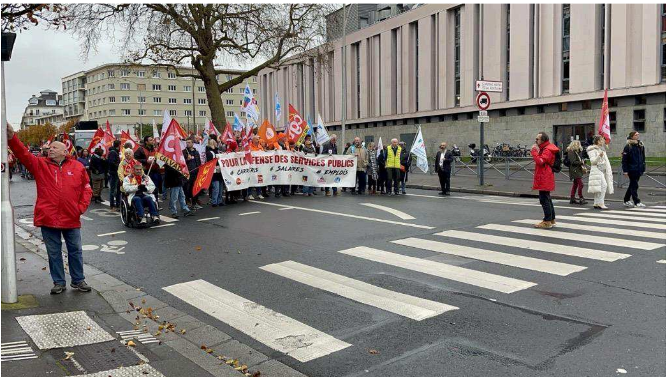
Les manifestants se sont rassemblés devant la préfecture de Caen, en fin de matinée. Là où le défilé a pris fin. Ouest-France