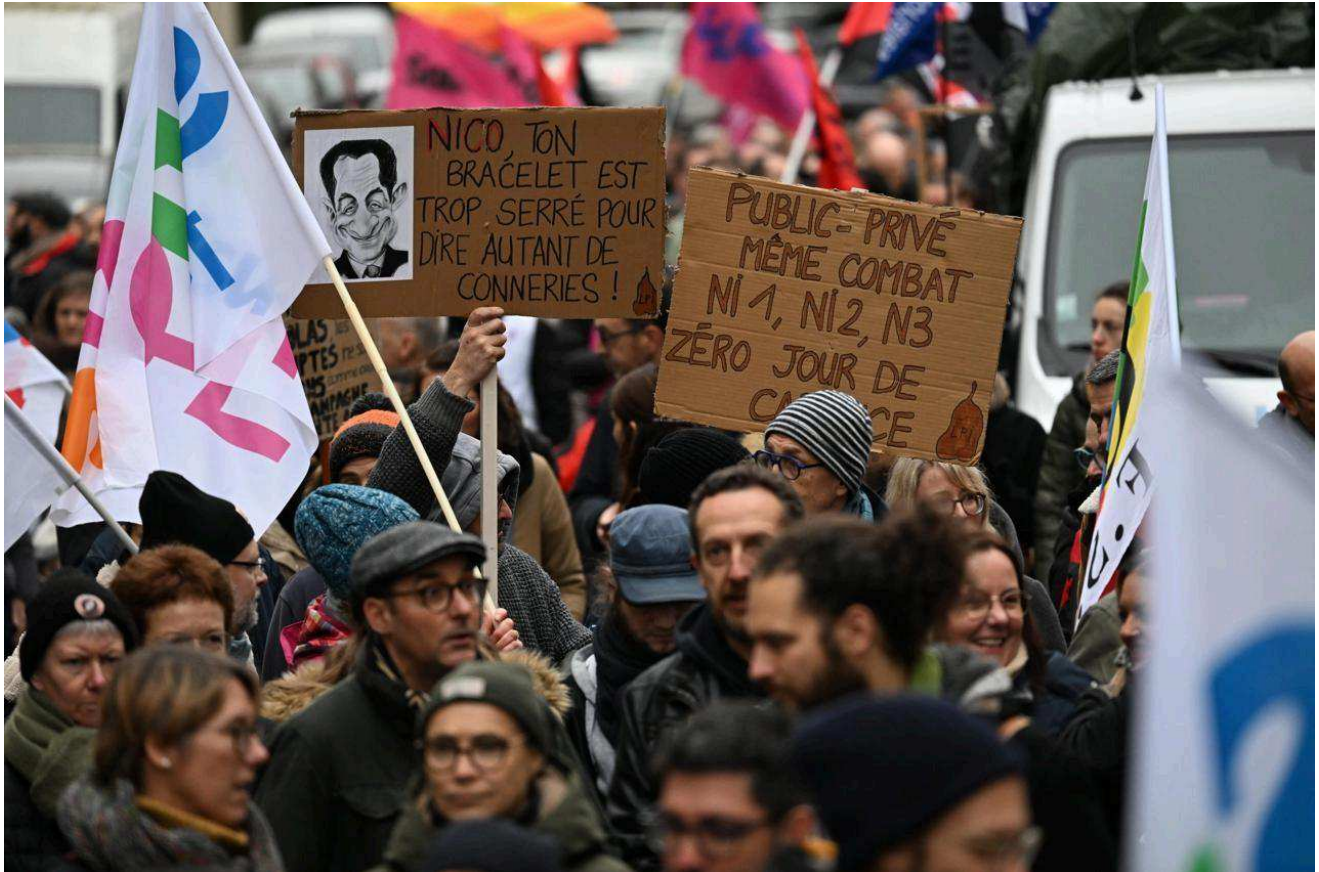
Quelques messages aperçus au sein du cortège caennais, ce jeudi 5 décembre 2024.

Selon une première estimation des forces de l'ordre, les manifestants seraient entre 2 500 et 2 700. Les syndicats, de leur côté, annoncent 6 000 personnes.