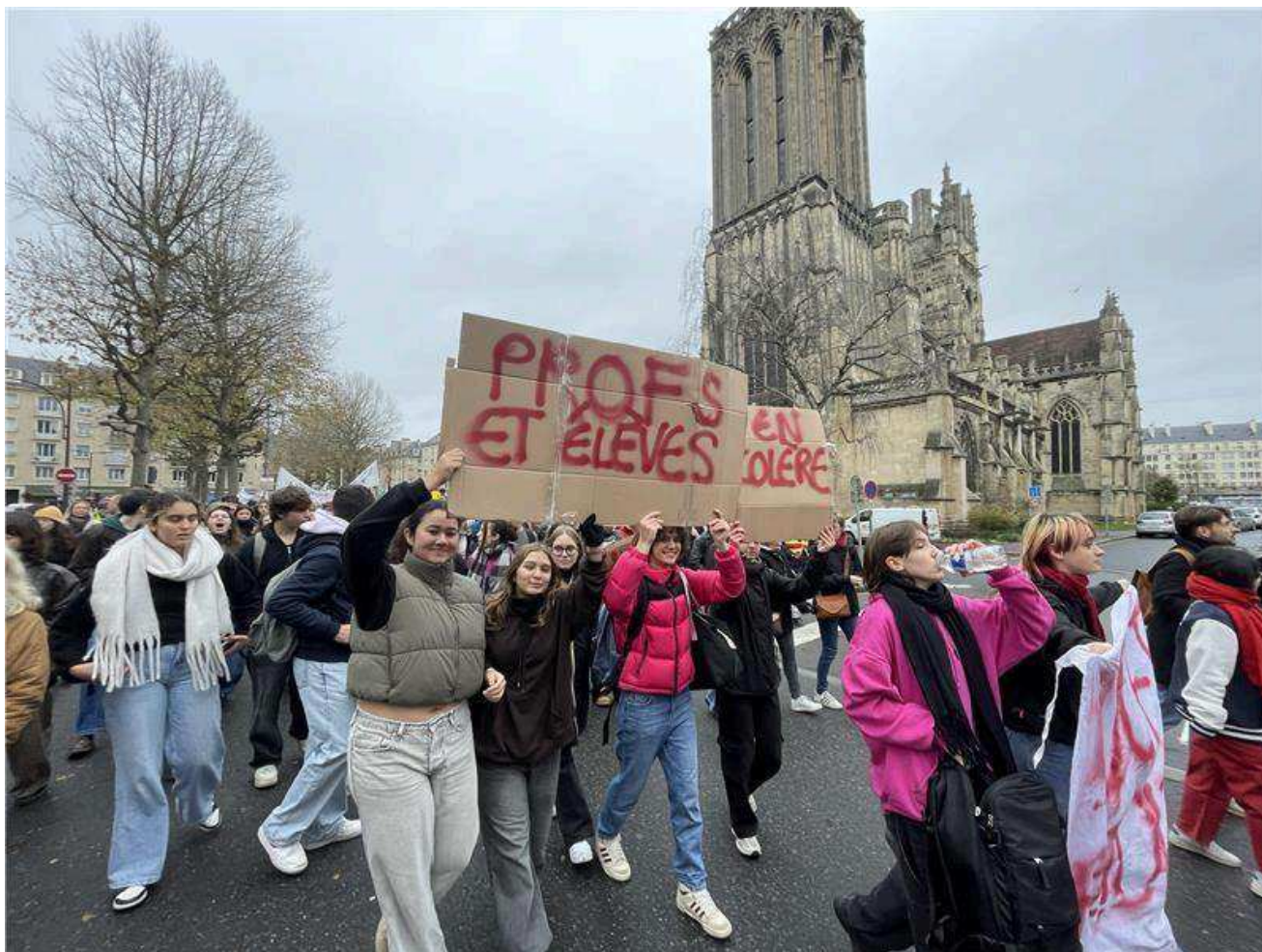
Des groupes de lycéens se sont joints au cortège des fonctionnaires, ce jeudi 5 décembre 2024, à Caen.