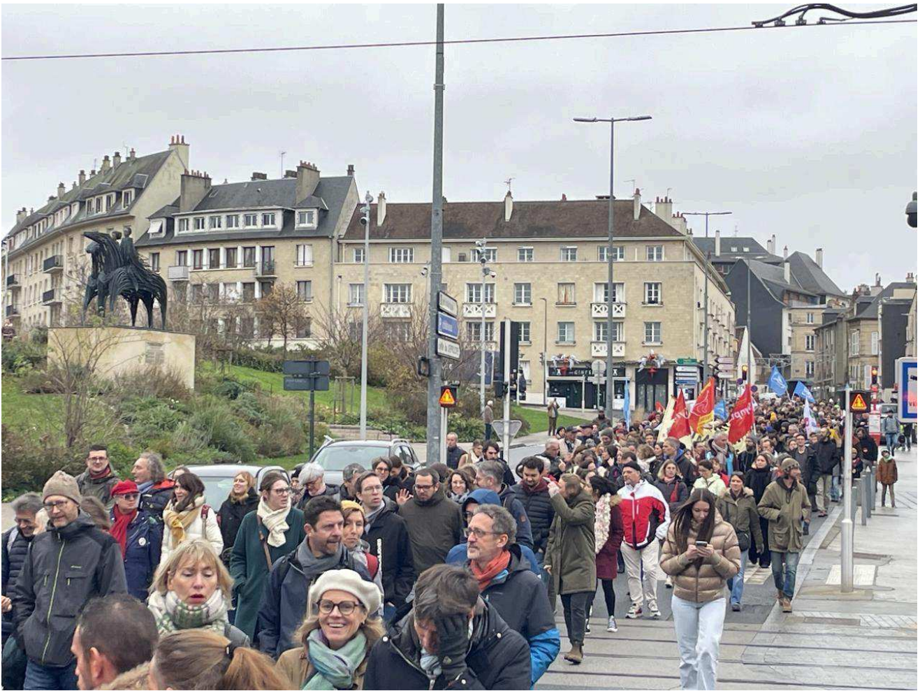
La fin du cortège au niveau du château de Caen.