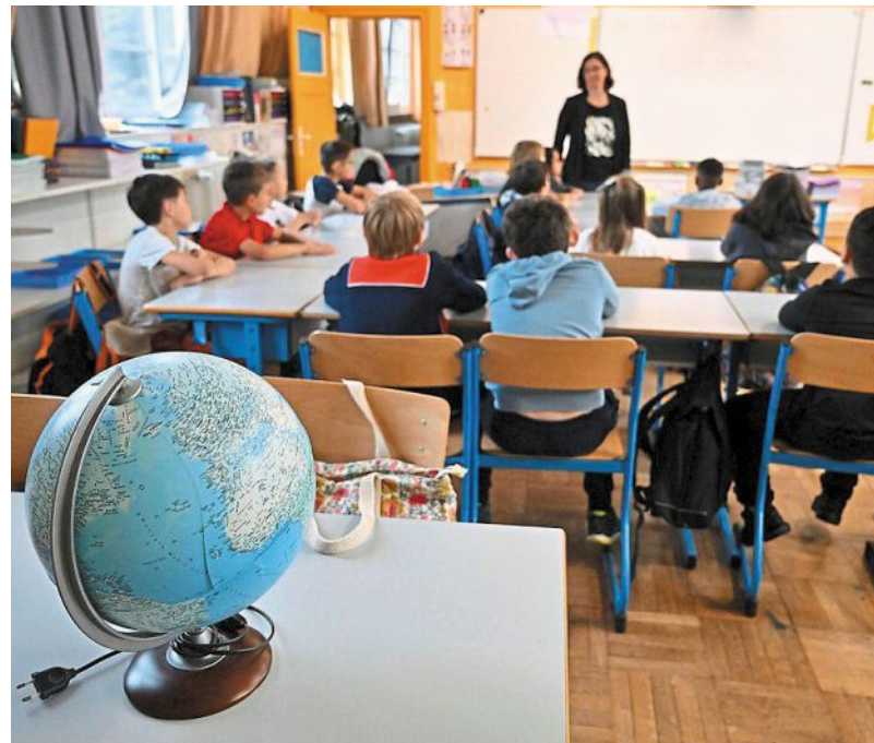
Pour les enseignants, le triple niveau signifie davantage de préparation.

Les deux enseignantes ne veulent pas noircir le tableau pour autant. « Un RPI est loin d'être horrible, explique Camille. Deux à trois classes par site me semblent être un minimum, mais cela ne dépend pas de nous. » Quid en cas de fermeture ? « Ma classe est grande et lumineuse, témoigne Sandrine. Mes con-