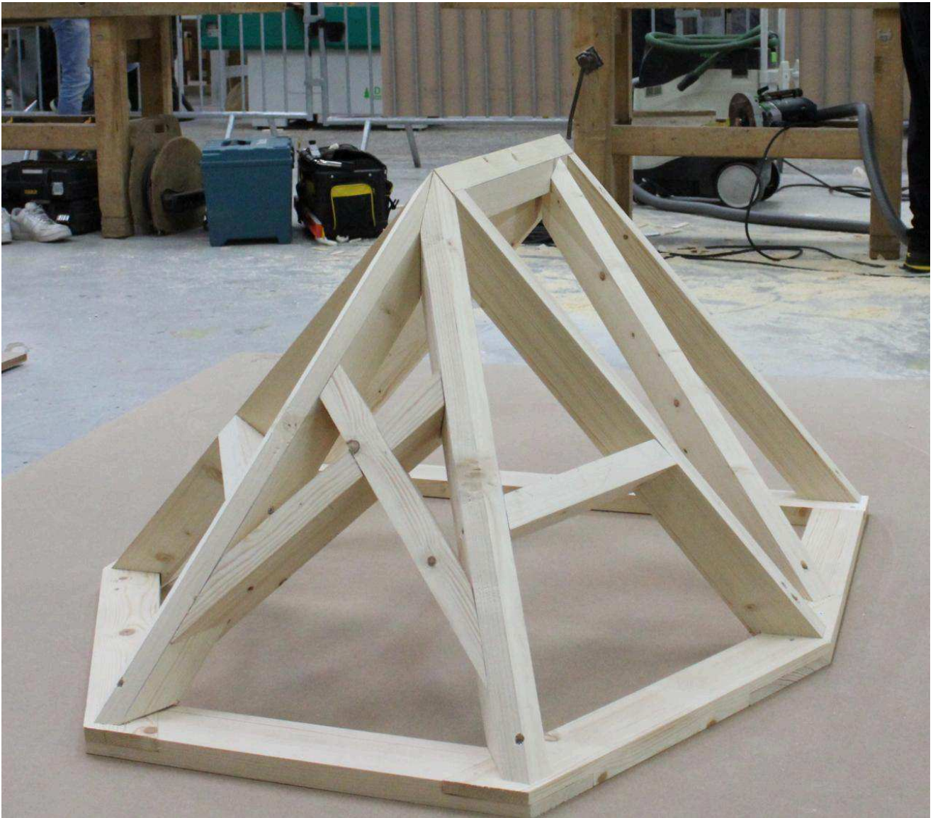
L'une des deux pièces de charpente à réaliser en 14 heures. A. D.