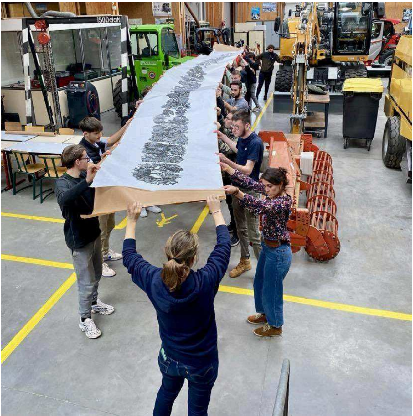
L'œuvre a été gravée sur un papier chinois.