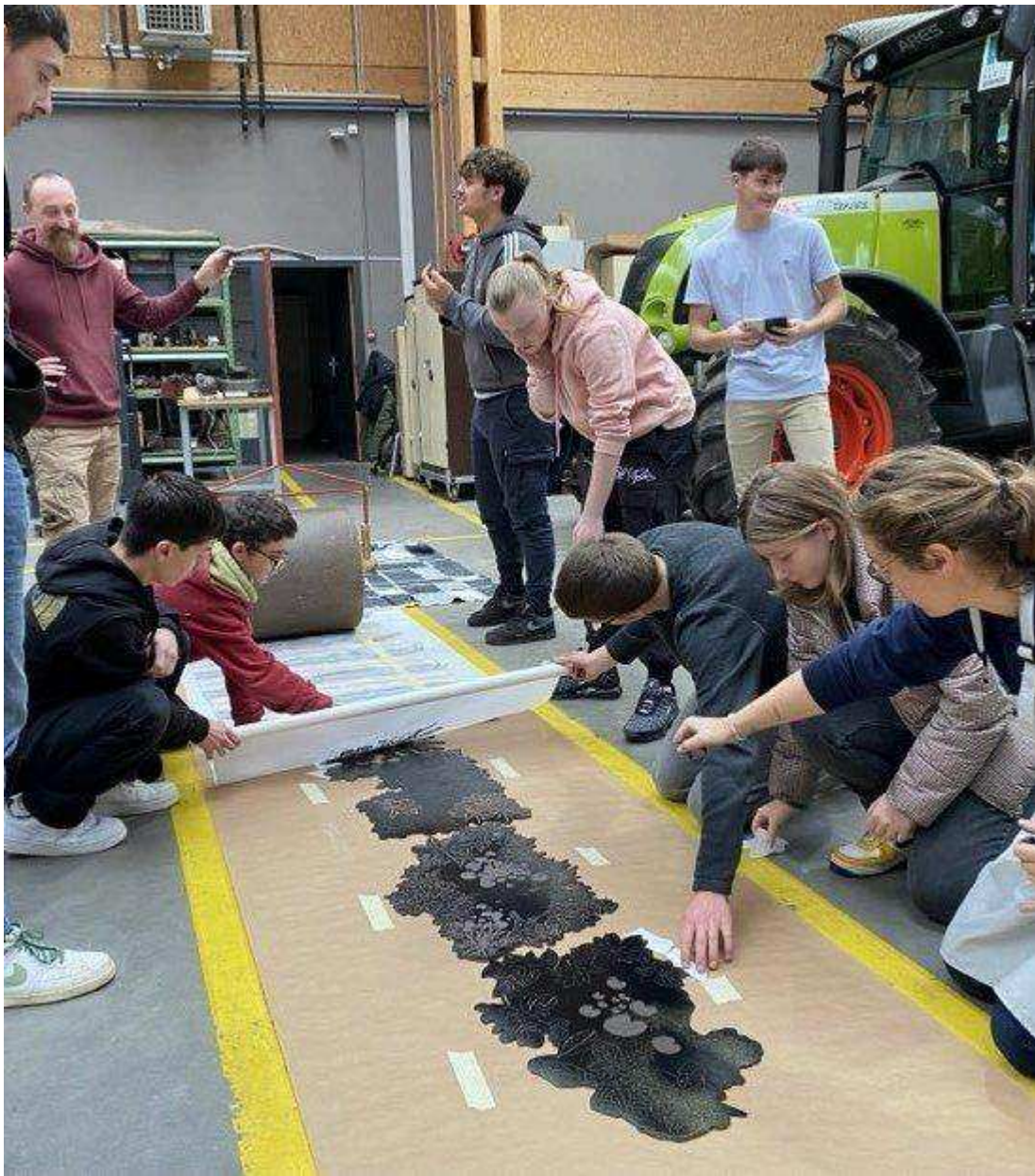
Installation des matrices avant l'impression MP