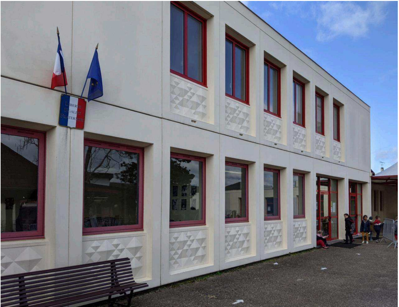
L'école et le centre de loisirs des Tilleuls accueillent un total de 266 enfants. MVT architectes