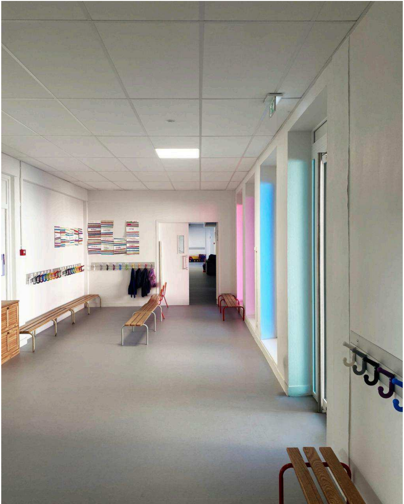
... et après les travaux. MVT architectes