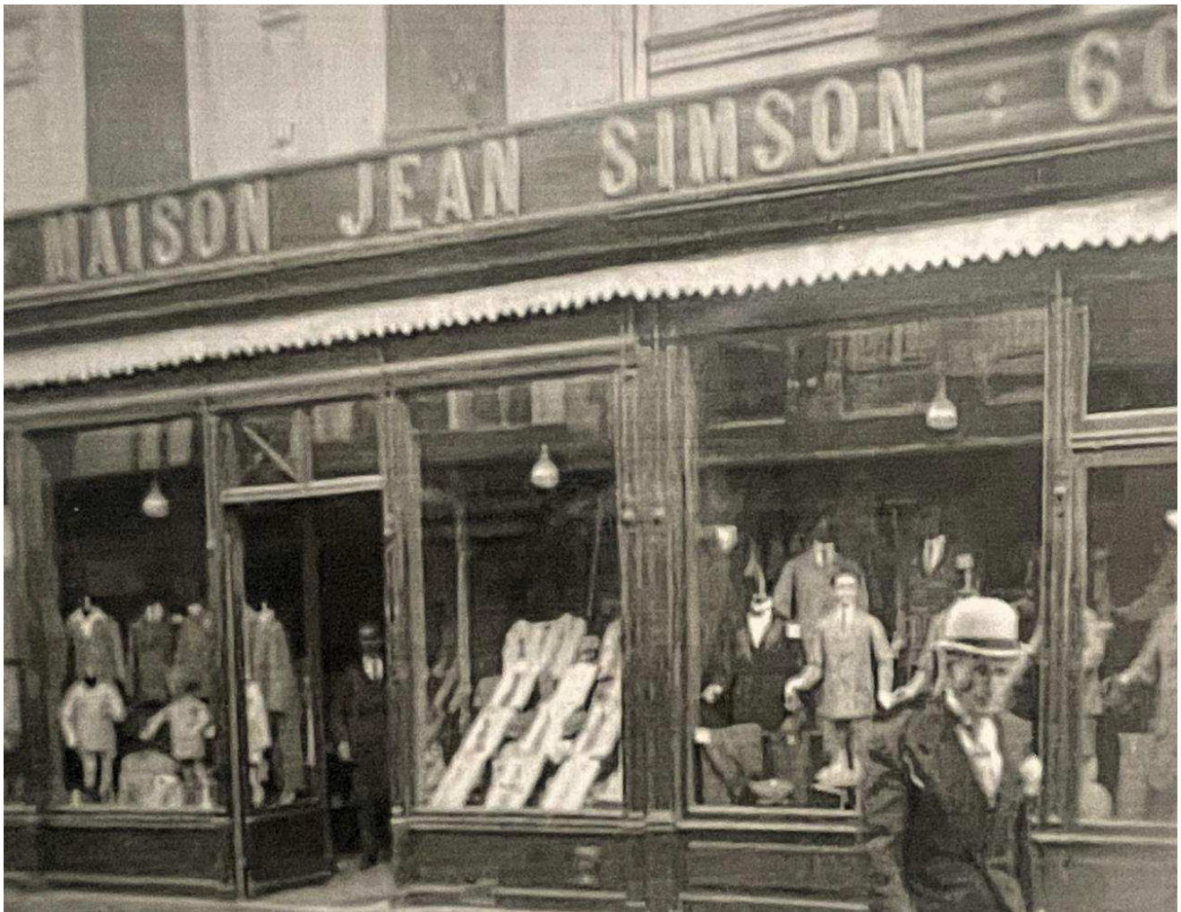
Le magasin de la famille « A la belle jardinière » était installé dans la rue Thiers.