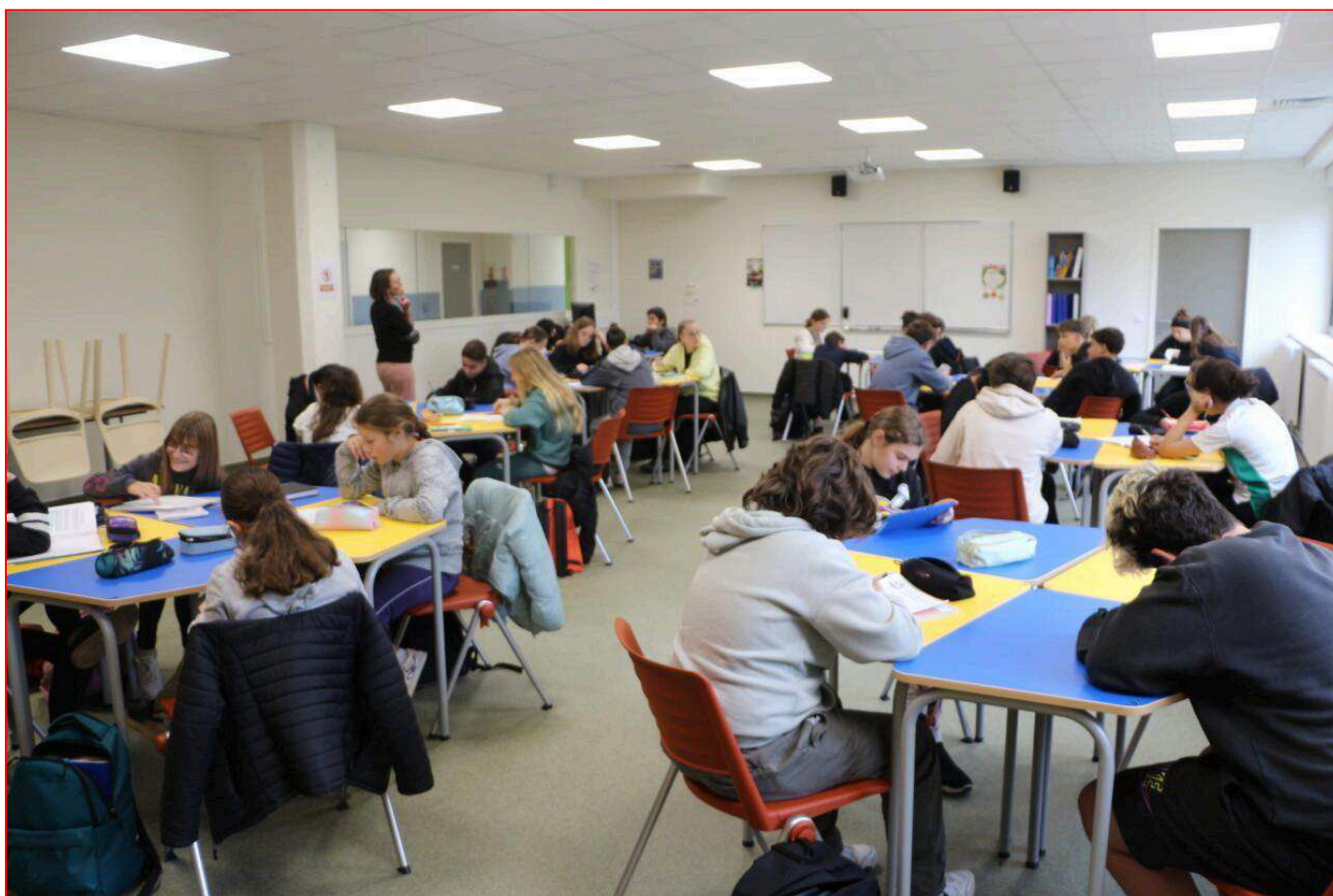
Les élèves déjà au travail dans la nouvelle salle de permanence du collège Simone-Signoret.