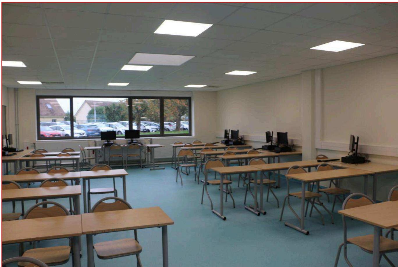
Une nouvelle salle de classe multiusage du collège du Val d'Hazey.