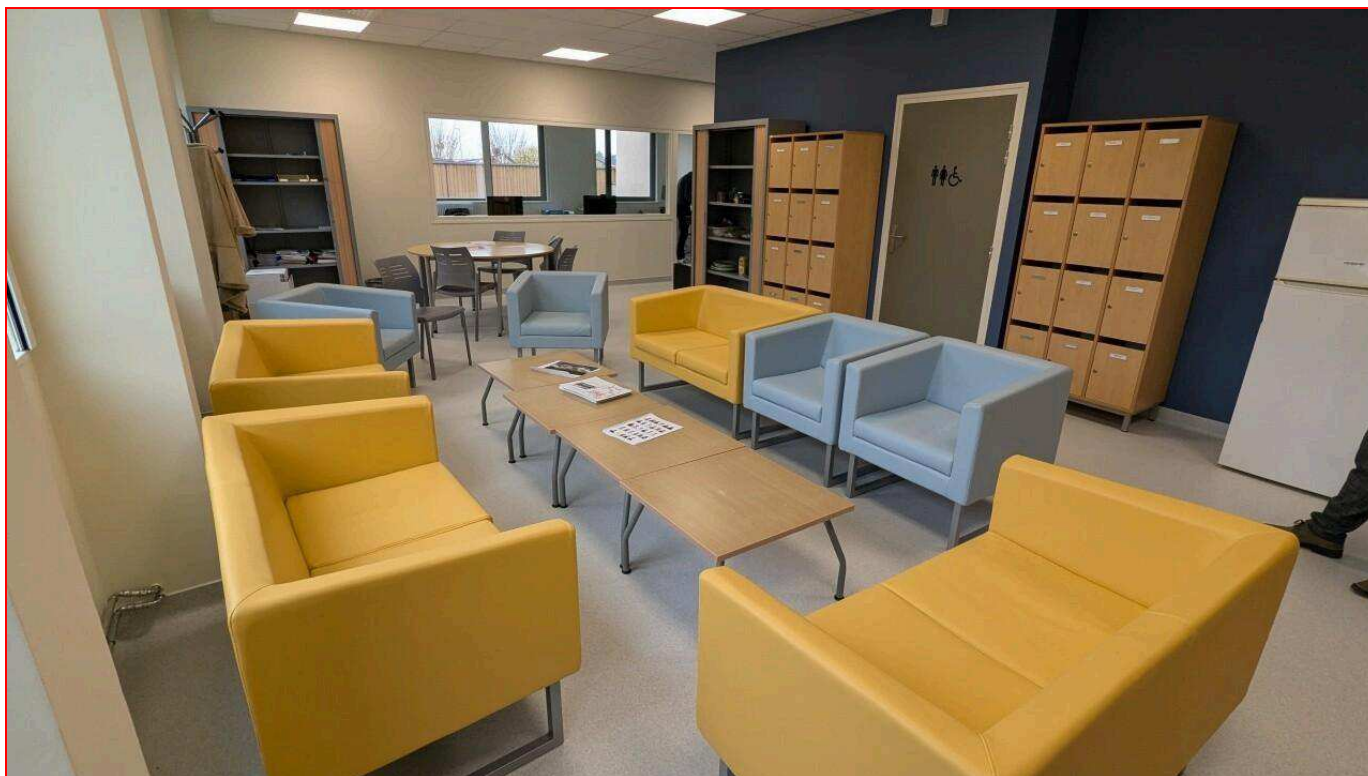
La salle à disposition des 35 professeurs du collège Simone-Signoret au Val d'Hazey (Eure).