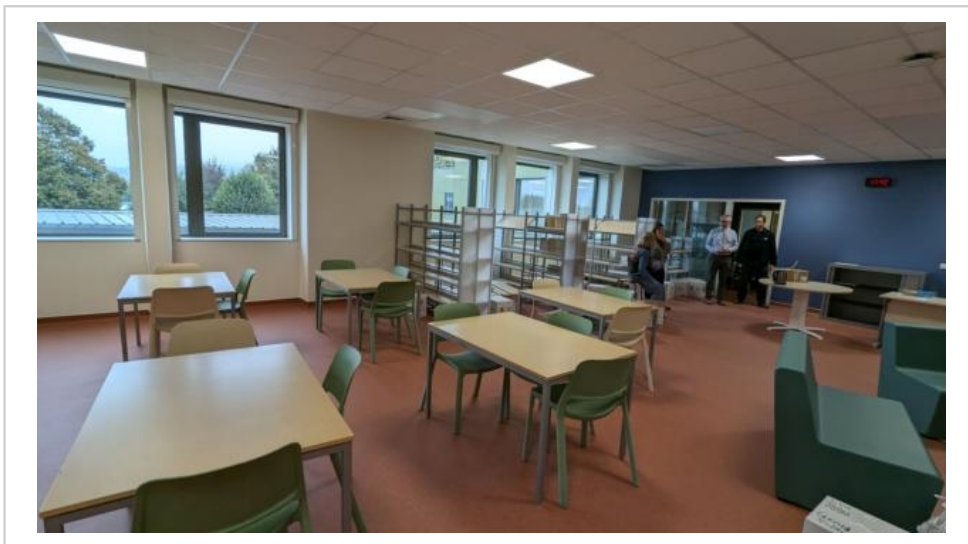
Le CDI du collège reste en cours d'aménagement en ce début novembre.