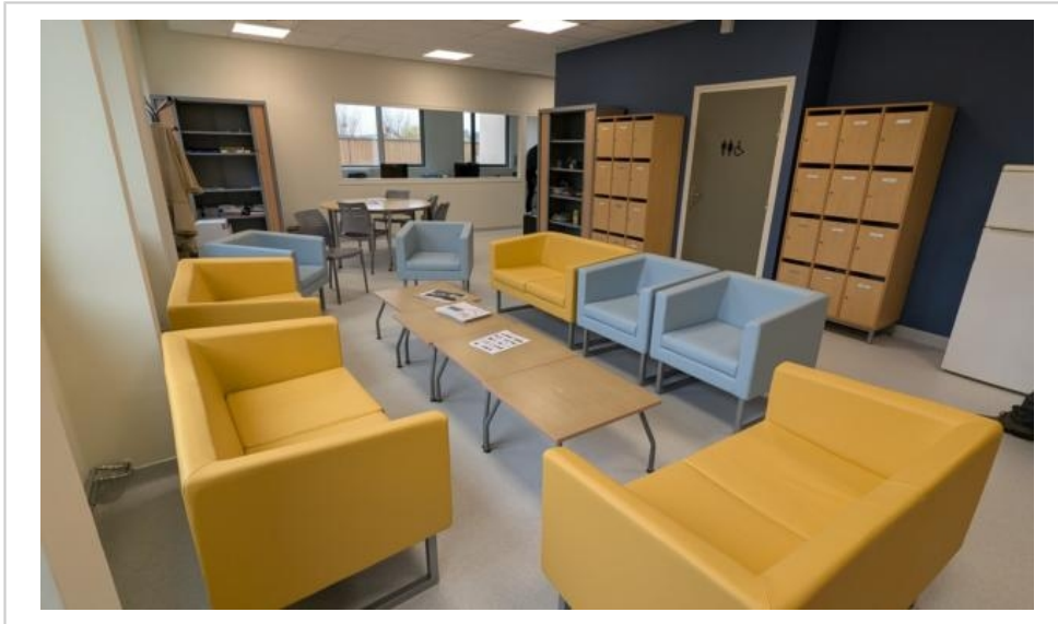
La salle à disposition des 35 professeurs du collège.