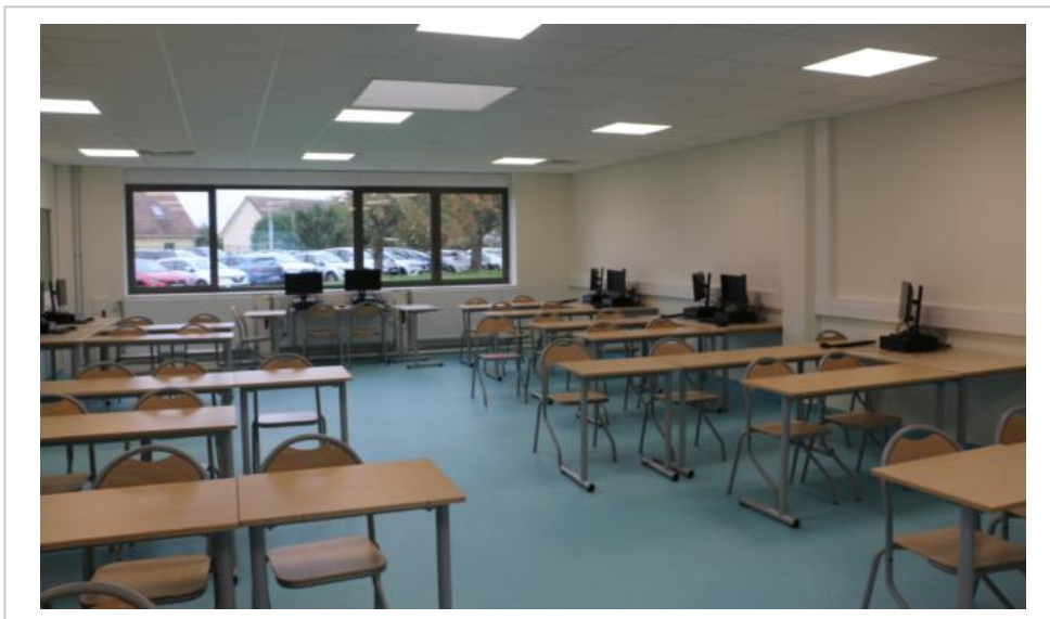
Une nouvelle salle de classe multiusage.