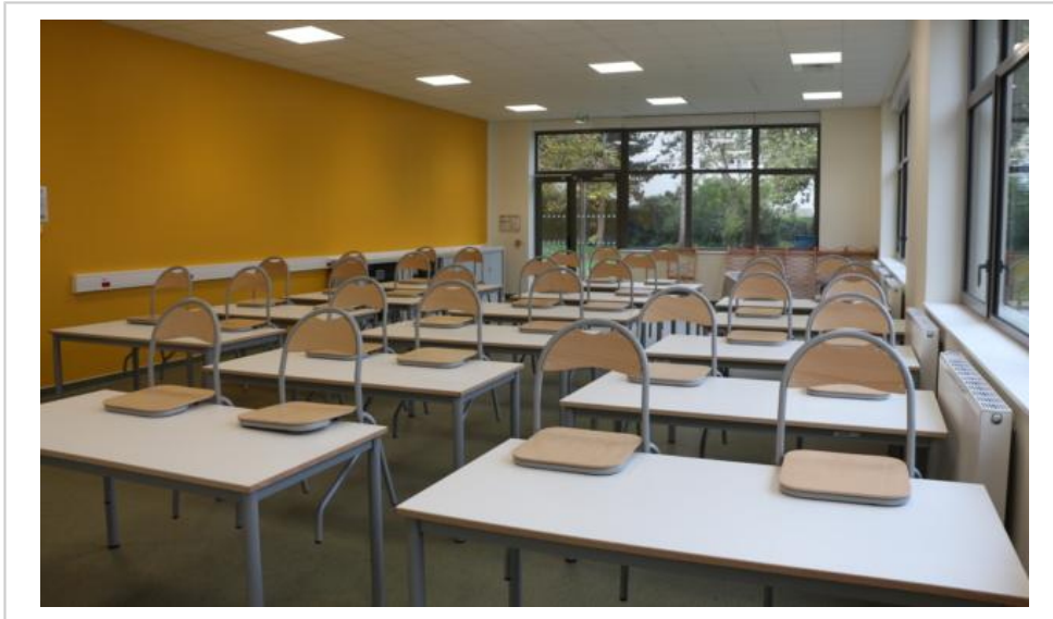
La nouvelle salle d'arts plastiques.