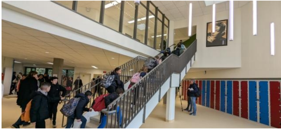
Les 475 élèves du collège Simone-Signoret ont découvert leur nouvel établissement flambant neuf en début de semaine.