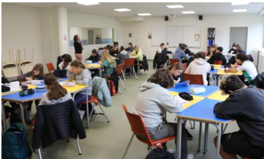
Les élèves déjà au travail dans la nouvelle permanence.