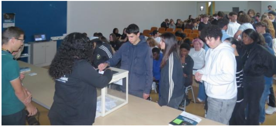
Les 117 lycéens ont voté pour leur reportage préféré parmi les dix sélectionnés dans la catégorie Télévision.