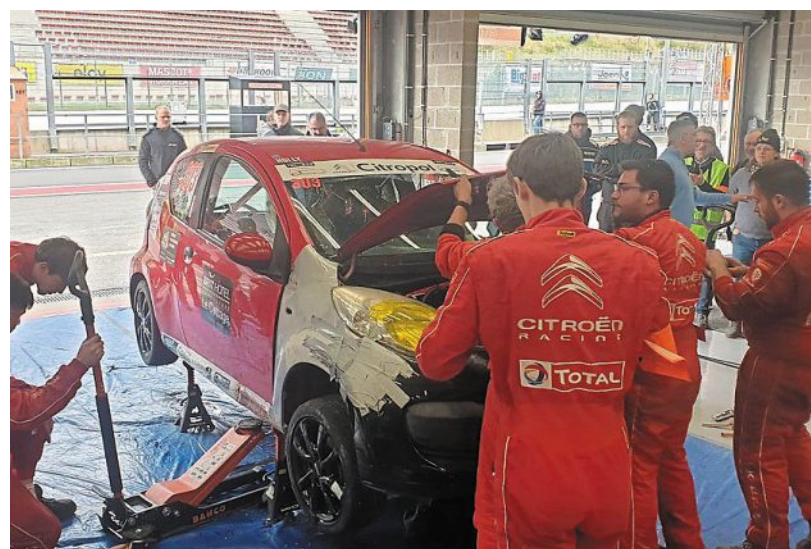
Après une violente sortie de piste, Holly la C1 a subi de nombreux dommages, aucune certitude quant à la possibilité qu'elle revienne sur le circuit, c'était sans compter sur la capacité de la jeune équipe de mécaniciens qui ont pu dans un temps record la remettre sur ses roues.

sion, la cohésion d'équipe et le professionnalisme de ces onze mécaniciens. Ils peuvent être fiers de ce qu'ils ont réalisé. »