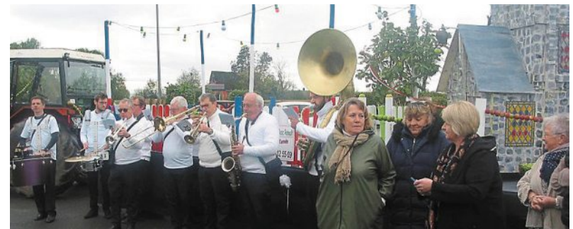
Les musiciens de la Banda Max ont accompagné la réception du char du comité des fêtes.