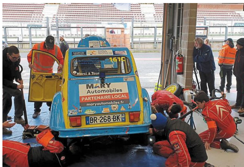
Tous s'affairent autour de Biellette la 2 CV qui a nécessité quelques réparations après avoir été malmenée par une voiture concurrente, mission réussie par l'équipe de jeunes mécaniciens, Biellette a pu réaliser une très belle course et n'a pas défailli.