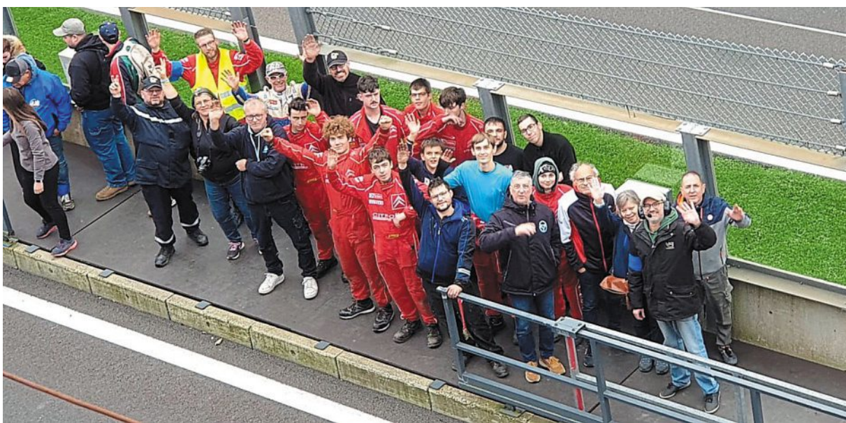
Mécaniciens, bénévoles, pilotes étaient heureux et fiers de voir Holly la C1 et Biellette la 2 CV franchir la ligne d'arrivée, le défi a été relevé, faire en sorte que les deux autos terminent la course

Arrivée jeudi soir sur le circuit de Spa-Francorchamps, en Belgique, toute l'équipe de bénévoles, élèves et pilotes du lycée Don Bosco de Giel-Courteilles a assisté vendredi aux essais de la C1 dont c'était la première course, avec beaucoup d'espoir. Le défi cette année pour les onze élèves était d'assurer le ravitaillement, le suivi et les réparations des deux Citroën engagées sur les 24 Heures 2 CV, Biellette, la 2 CV dont c'était la huitième participation et la nouvelle venue, Holly la C1.