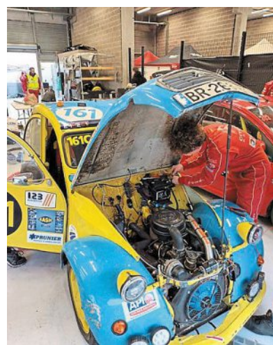
Vendredi matin, Oscar, étudiant en BTS mécanique, intervient sur Biellette, la 2 CV afin qu'elle soit prête pour les qualifications.

Giel-Courteilles — Vivre les 24 Heures 2 CV à Spa, en immersion au sein d'une équipe est devenu une réalité pour onze élèves en mécanique du lycée professionnel. Ils racontent leur aventure.