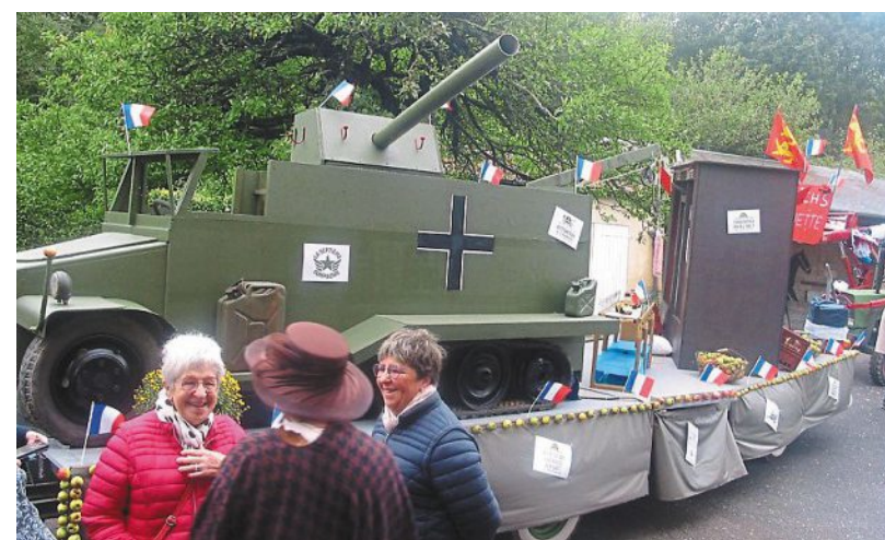
Prêts pour le départ.

Pour le comité des fêtes, deux chars sinon rien