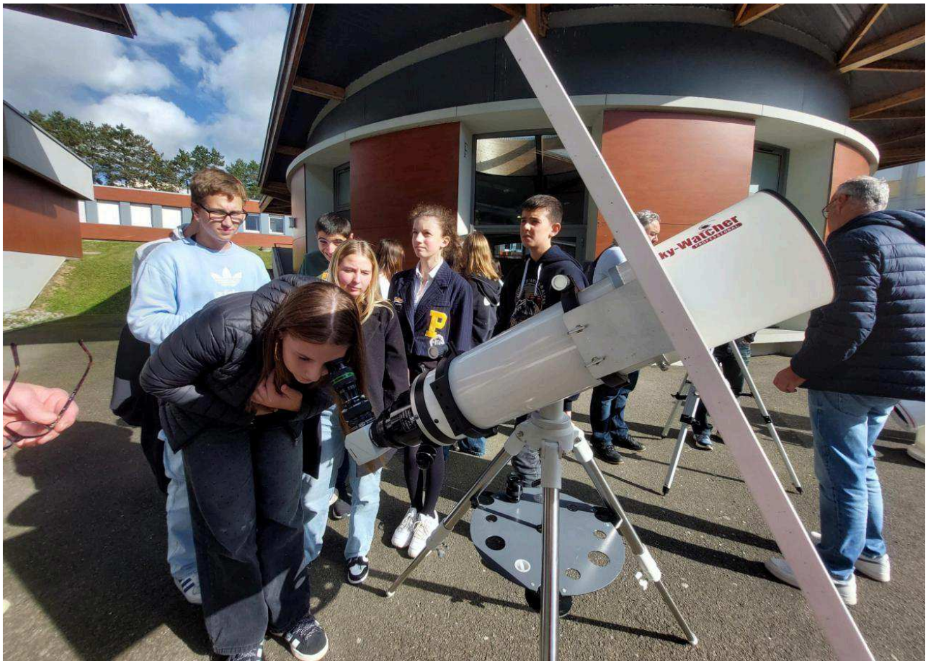
Observation du soleil avec Astroneuf.