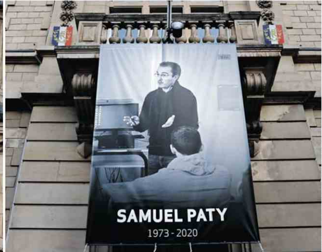
Ce lundi, l'Éducation nationale rend hommage à Dominique Bernard et Samuel Paty, tous deux tombés sous les coups du terrorisme islamiste parce qu'ils étaient enseignants.