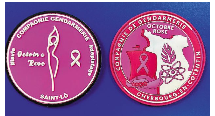
Les deux écussons spéciaux créés pour Octobre rose par les gendarmes de la Manche sont disponibles à la vente.

La gendarmerie de la Manche met en vente deux écussons de compagnies dédiés à Octobre rose.