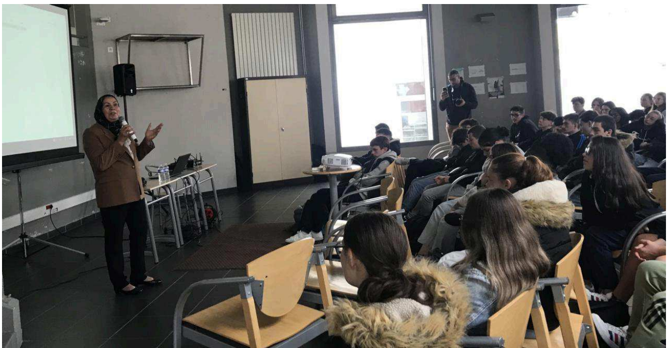
Les élèves sont à l'écoute du message