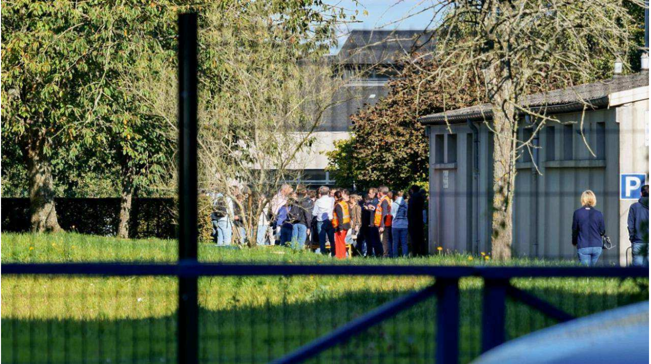
Après 1 h 30 de confinement, les élèves ont été rassemblés dans la cour de l'établissement.