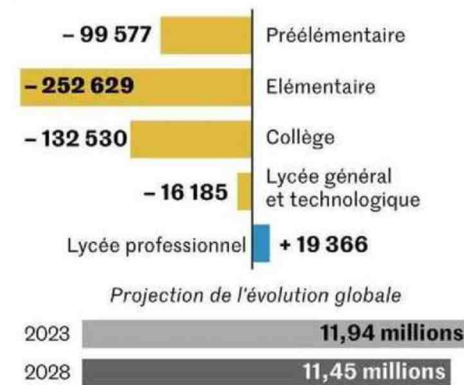
Evolution attendue des effectifs d'élèves des premier et second degrés entre 2023 et 2028, par niveau scolaire