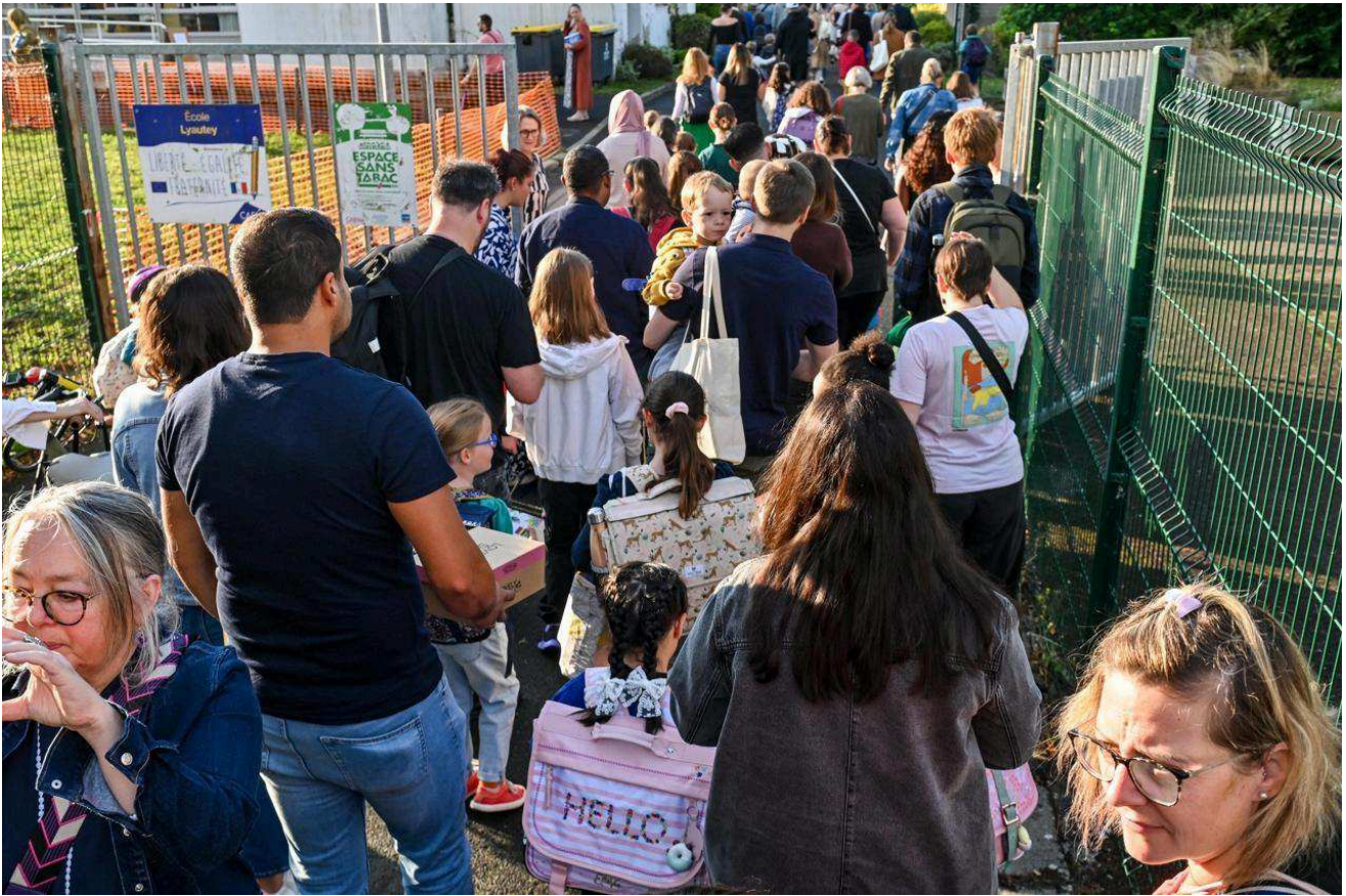
Rentrée des classes à Lyautey, à Caen.