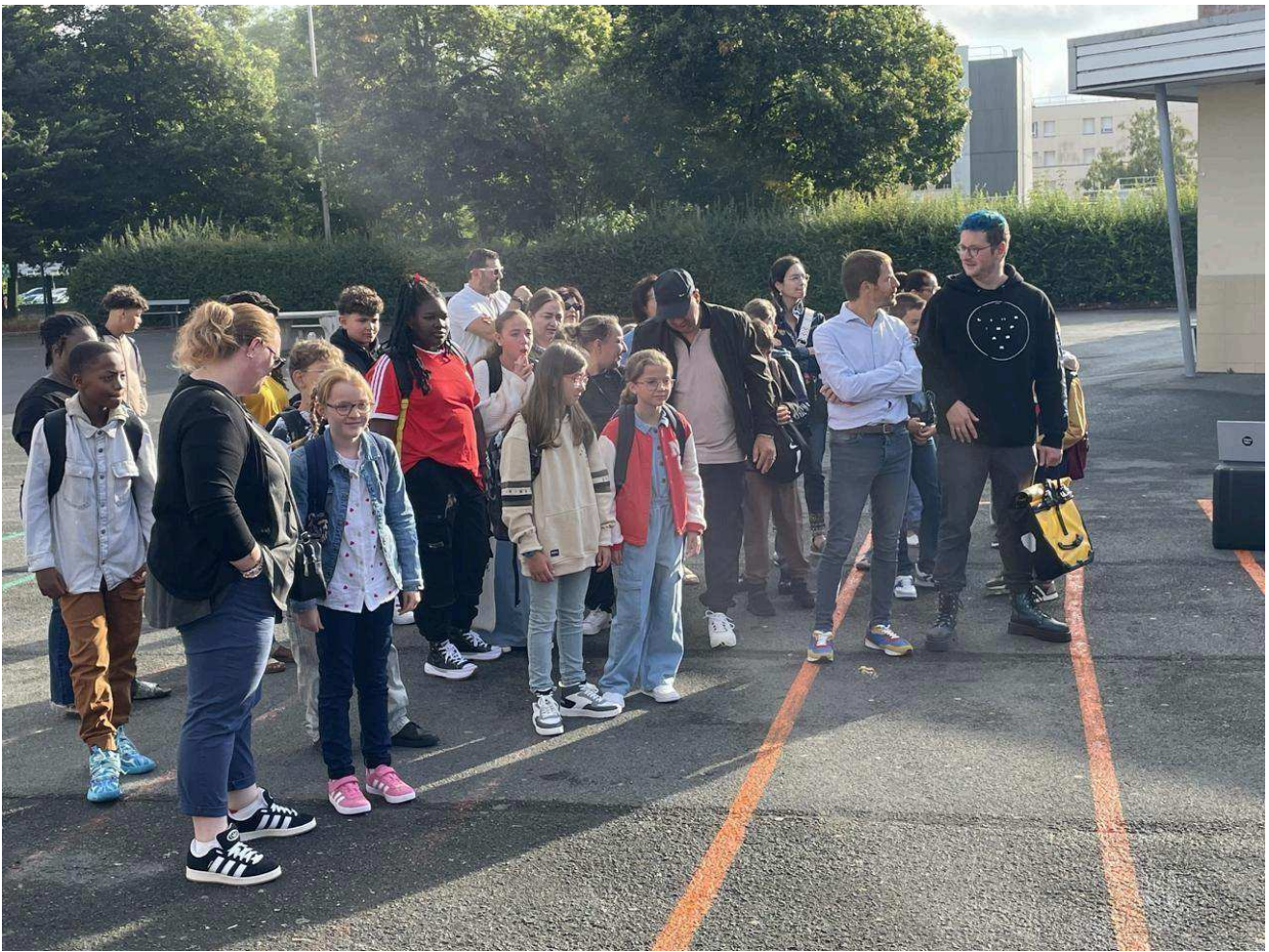
Le moment stressant de l'appel et la composition des classes de sixième au collège Lechanteur.