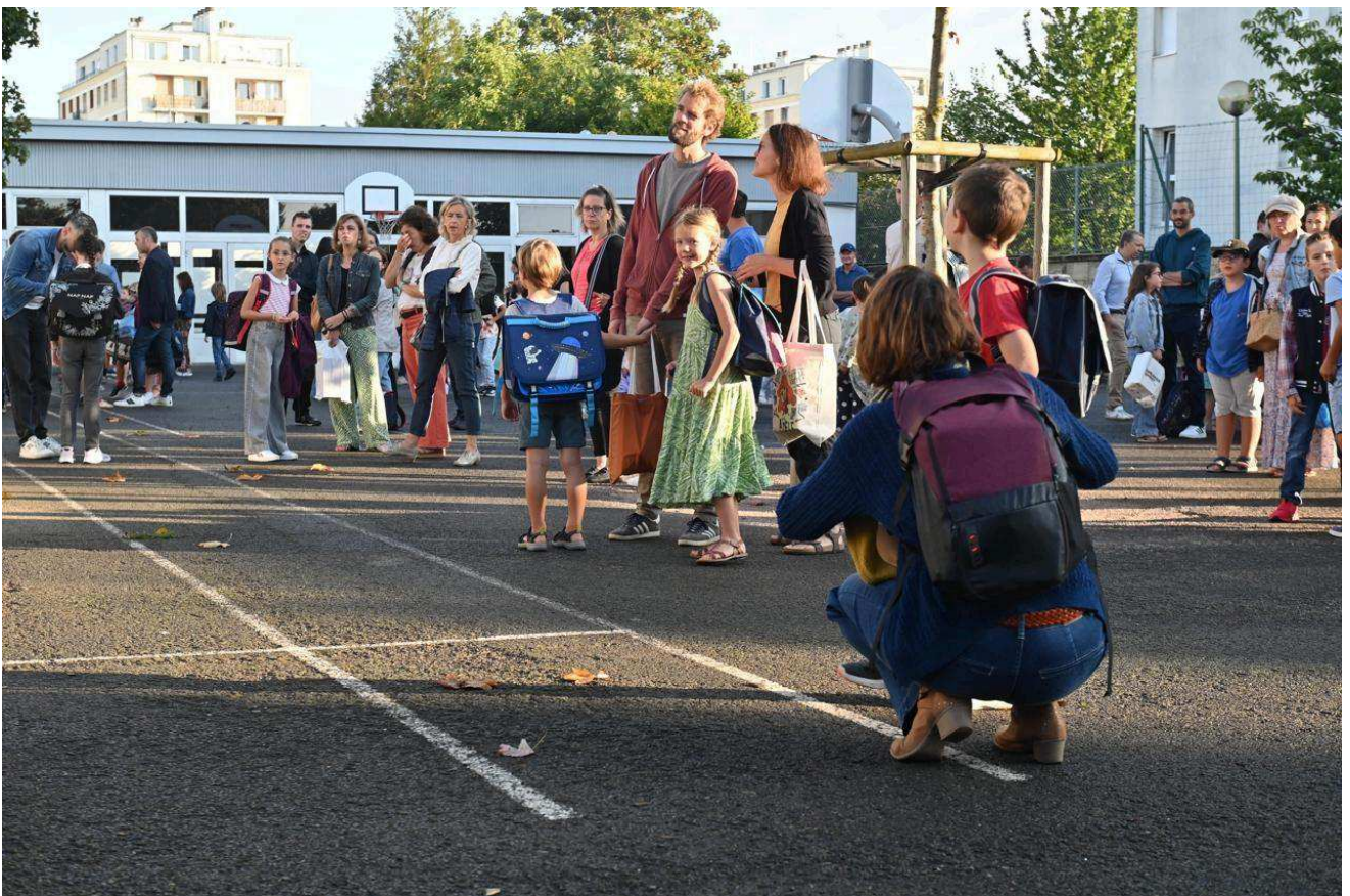
Entre appréhension et excitation, ce lundi 2 septembre 2024, c'est jour de rentrée scolaire à Caen, comme ici à l'école Lyautey.