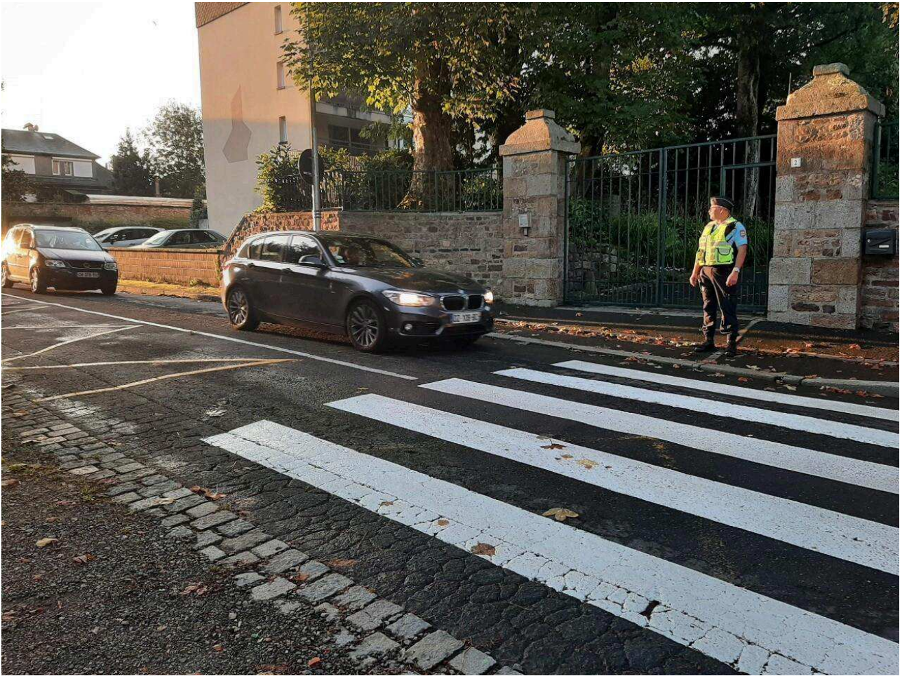
La gendarmerie a fait de la pédagogie.