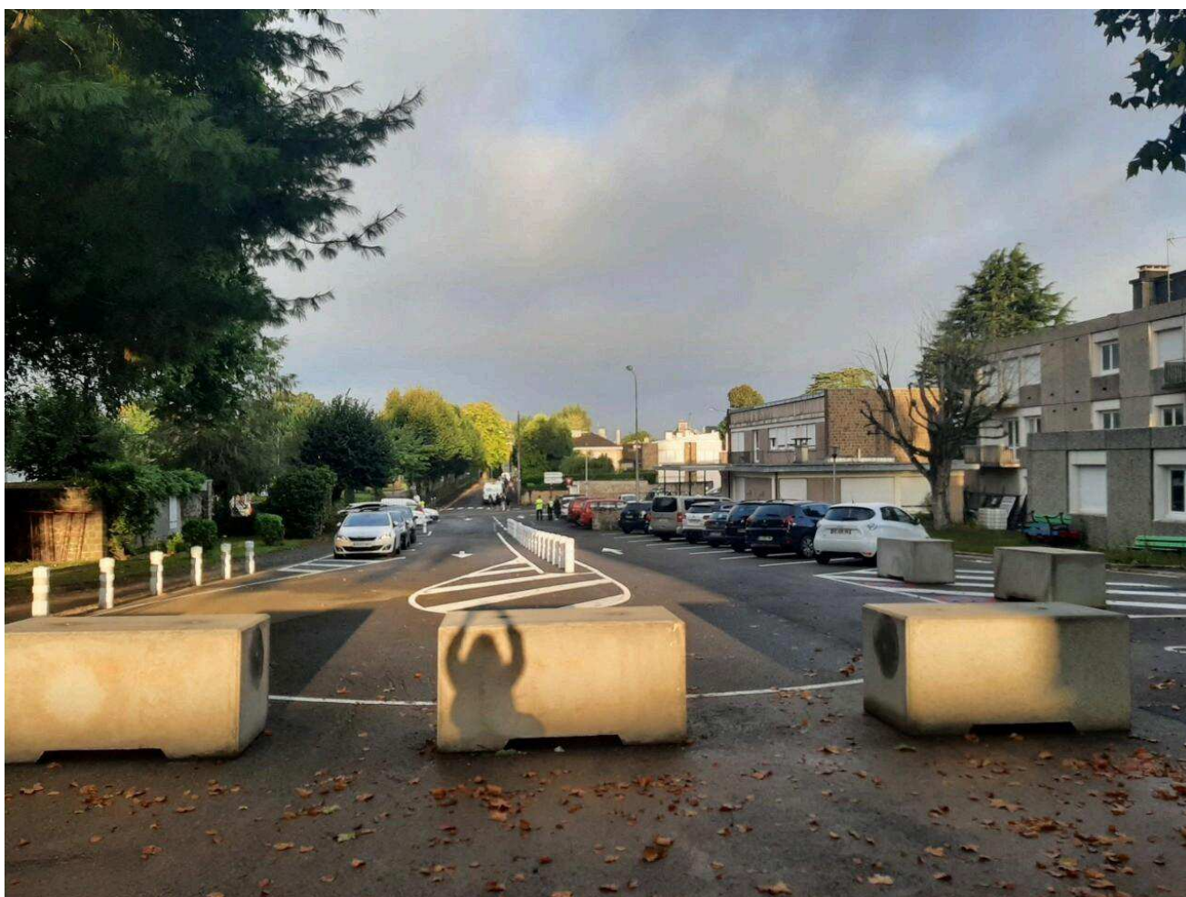
Les parents ont découvert les nouveaux aménagements.

Mais les habitudes ont la peau dure. La gendarmerie a donc eu recours à de la pédagogie, allant à la rencontre des automobilistes pour leur demander de circuler et les inviter à prendre le petit « rond-point » installé à l'entrée de l'établissement.