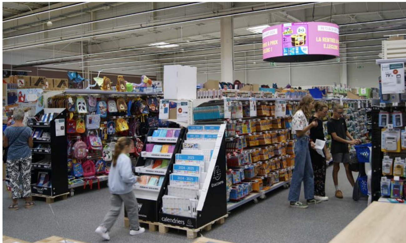
L'Allocation de rentrée scolaire ne couvre pas l'intégralité des dépenses ressenties par les familles pour la rentrée. Arthur PUYBERTIER

Un chiffre « positif mais logique » à la fois, étant donné que « les coûts de 2023 avaient connu une grosse inflation notamment avec le prix du papier qui s'était envolé ». Le phénomène s'est stabilisé, de la même manière que « les prix en magasin sont semblables à l'année dernière », remarque