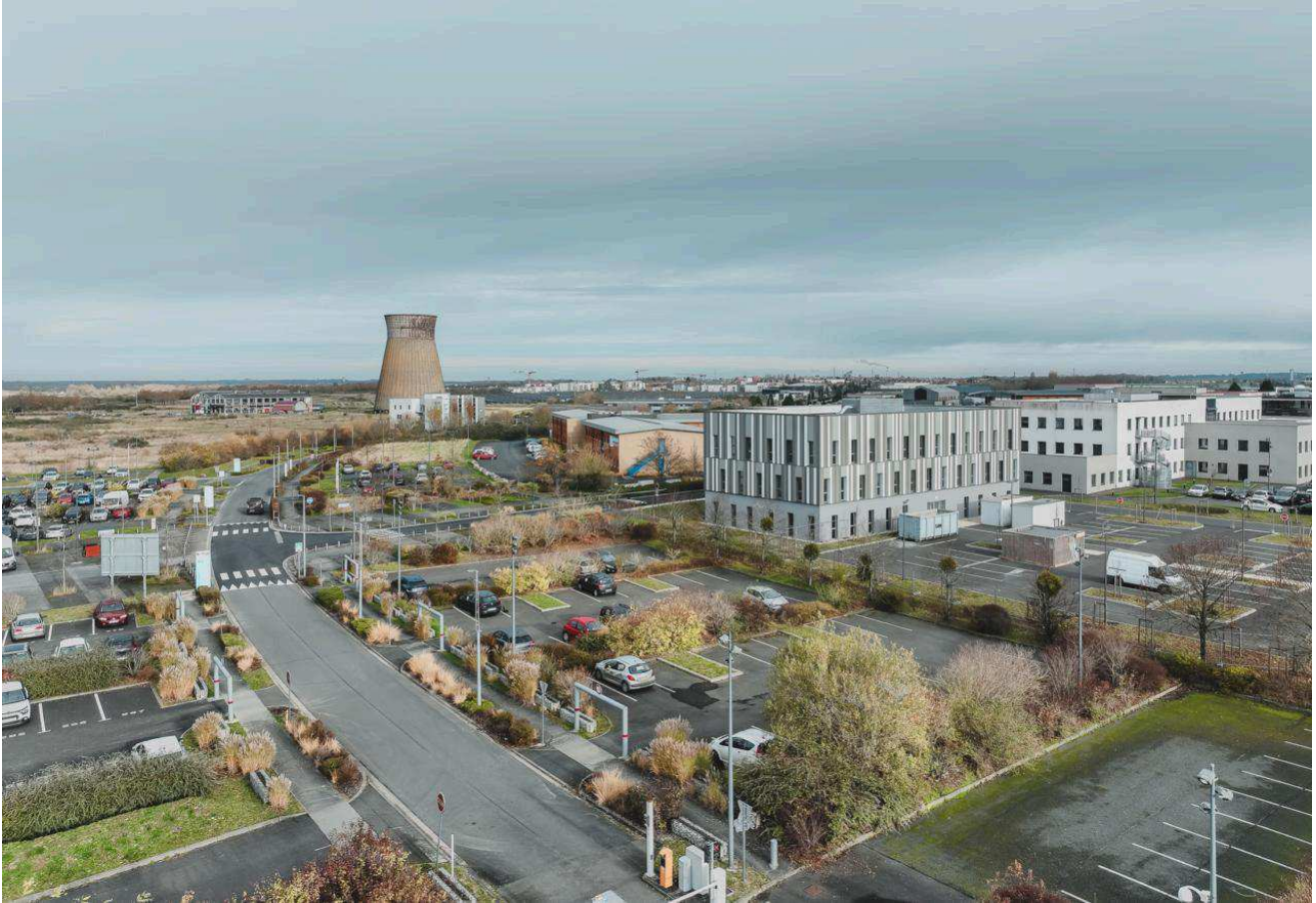
Le nouveau bâtiment de l'E2SE à Colombelles avec en fond le réfrigérant.