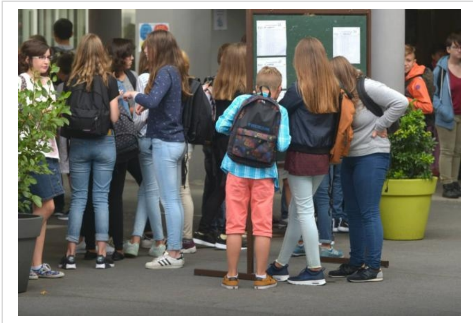
La plupart des collèges de la Manche sont classés en catégorie A ou B (sur cinq catégories).