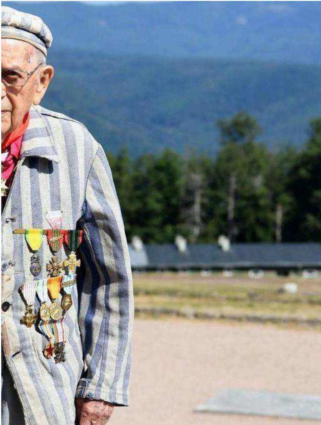
Jean Villeret en juin 2023 au camp du Struthof.