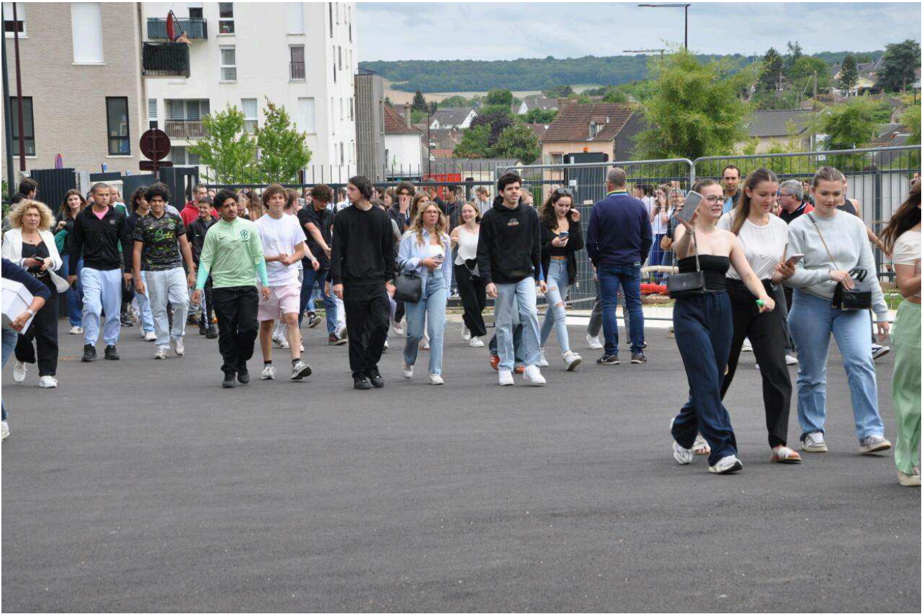
Les jeunes pressés de voir leurs résultats.