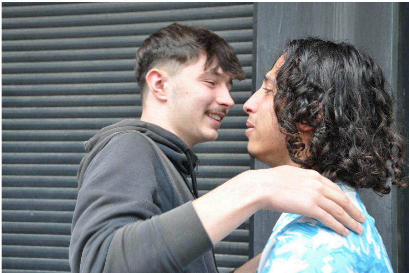
La joie d'être reçu avec les copains.

Parcoursup oblige, tous savent ce qu'ils vont faire à la rentrée (certains verront confirmer ou pas leur choix en fonction des notes obtenues).