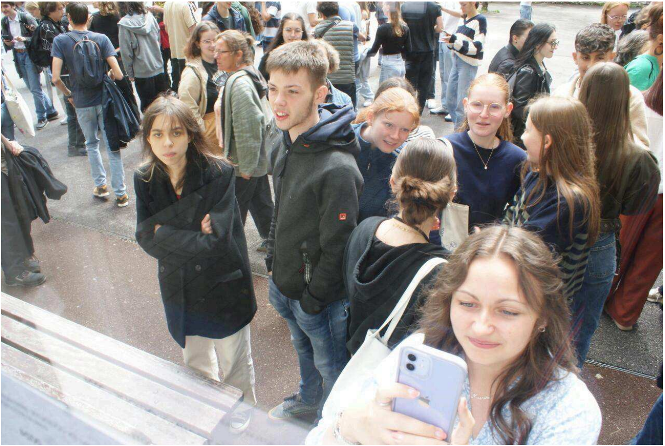
Les nouveaux bacheliers à Cherbourg (Manche).