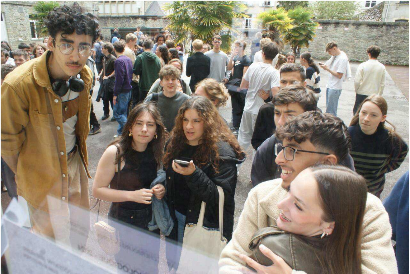
Les nouveaux bacheliers à Cherbourg (Manche).