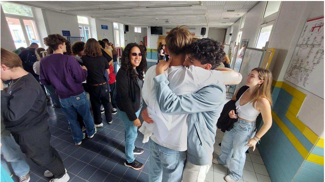
Les nouveaux bacheliers à Cherbourg (Manche).

Ce lundi 8 juillet 2024, les élèves de Terminale découvrent s'ils sont admis (ou non) au baccalauréat . Ambiance à Cherbourg (Manche) .