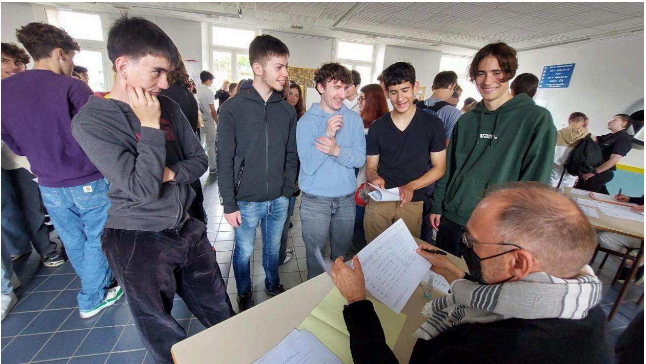
Les nouveaux bacheliers à Cherbourg (Manche).