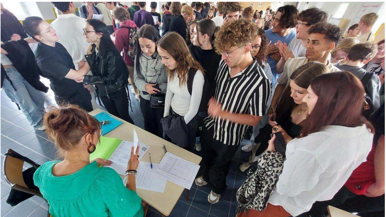
Les nouveaux bacheliers à Cherbourg (Manche).