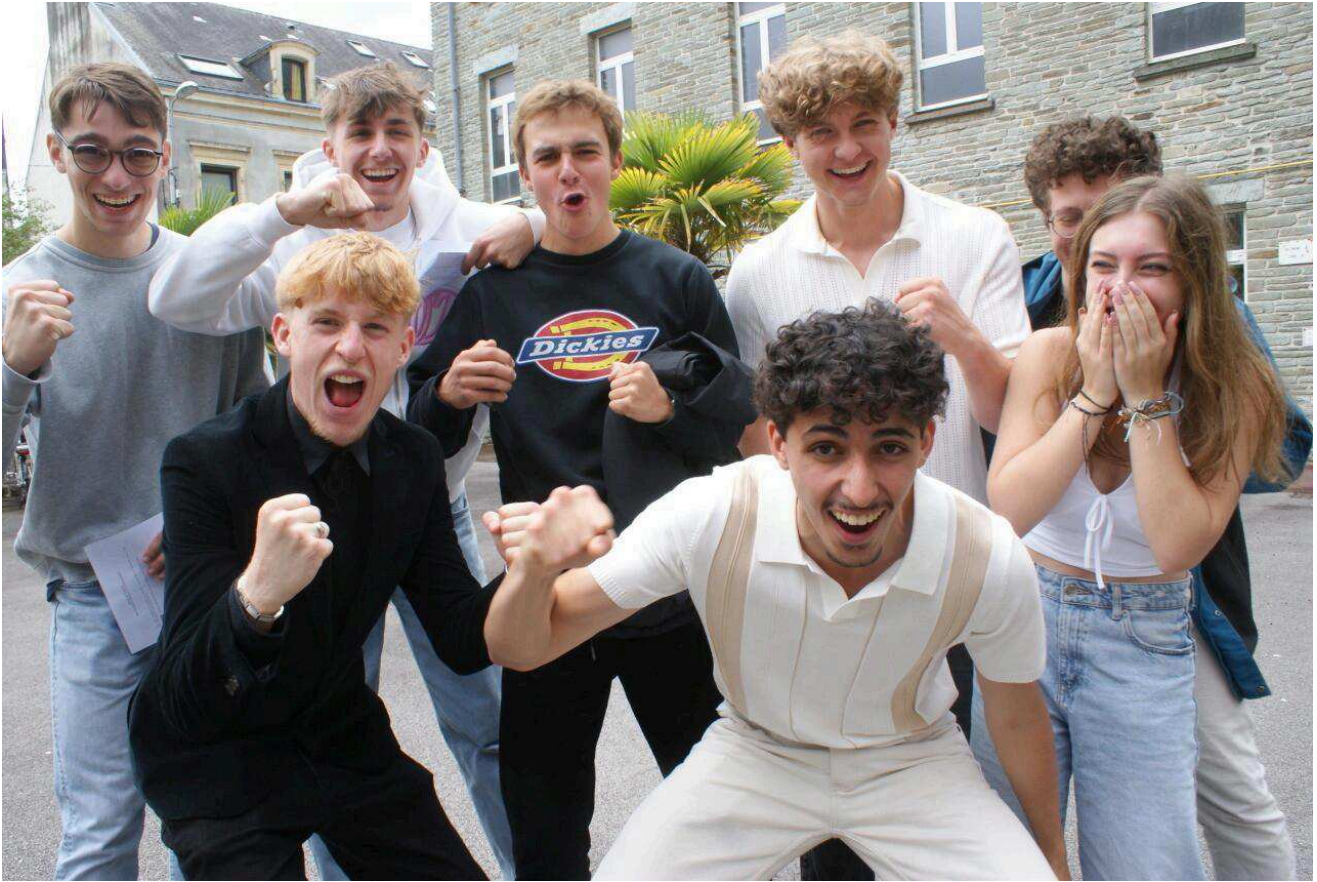
Les nouveaux bacheliers à Cherbourg (Manche).

Nous étions présents au lycée Grignard et au lycée Millet de Cherbourg (Manche) à 14h30 pétautes, heure à laquelle les résultats ont été rendus publics dans l'académie de Normandie . Ambiance.