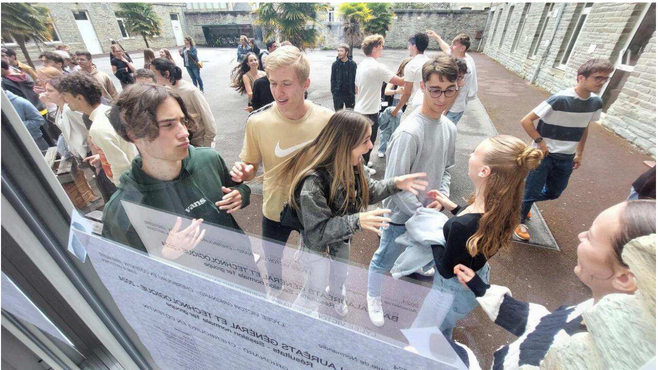
Les nouveaux bacheliers à Cherbourg (Manche).