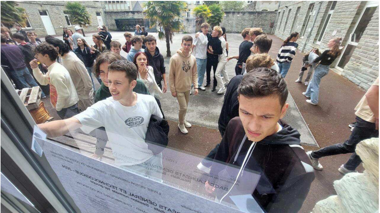
Les nouveaux bacheliers à Cherbourg (Manche).