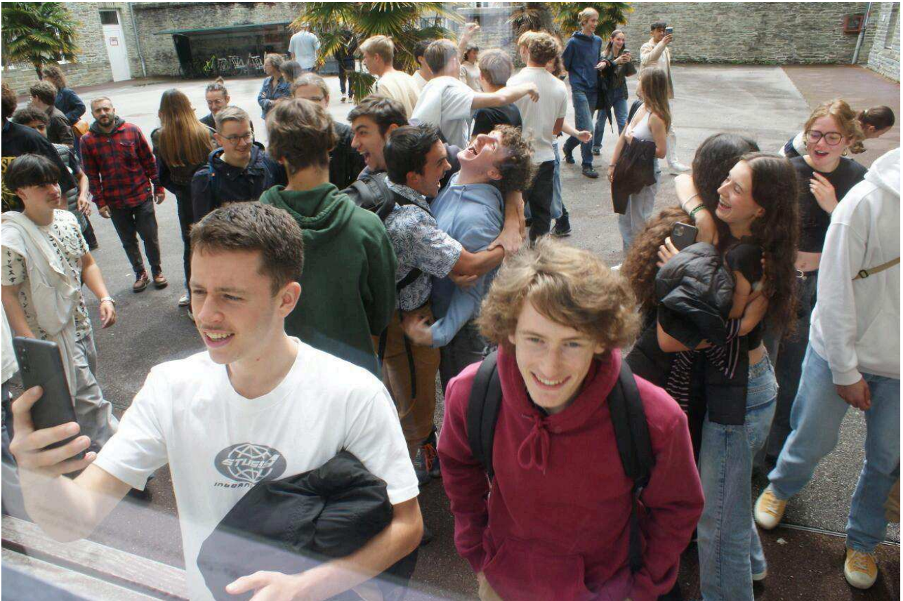
Les nouveaux bacheliers à Cherbourg (Manche).