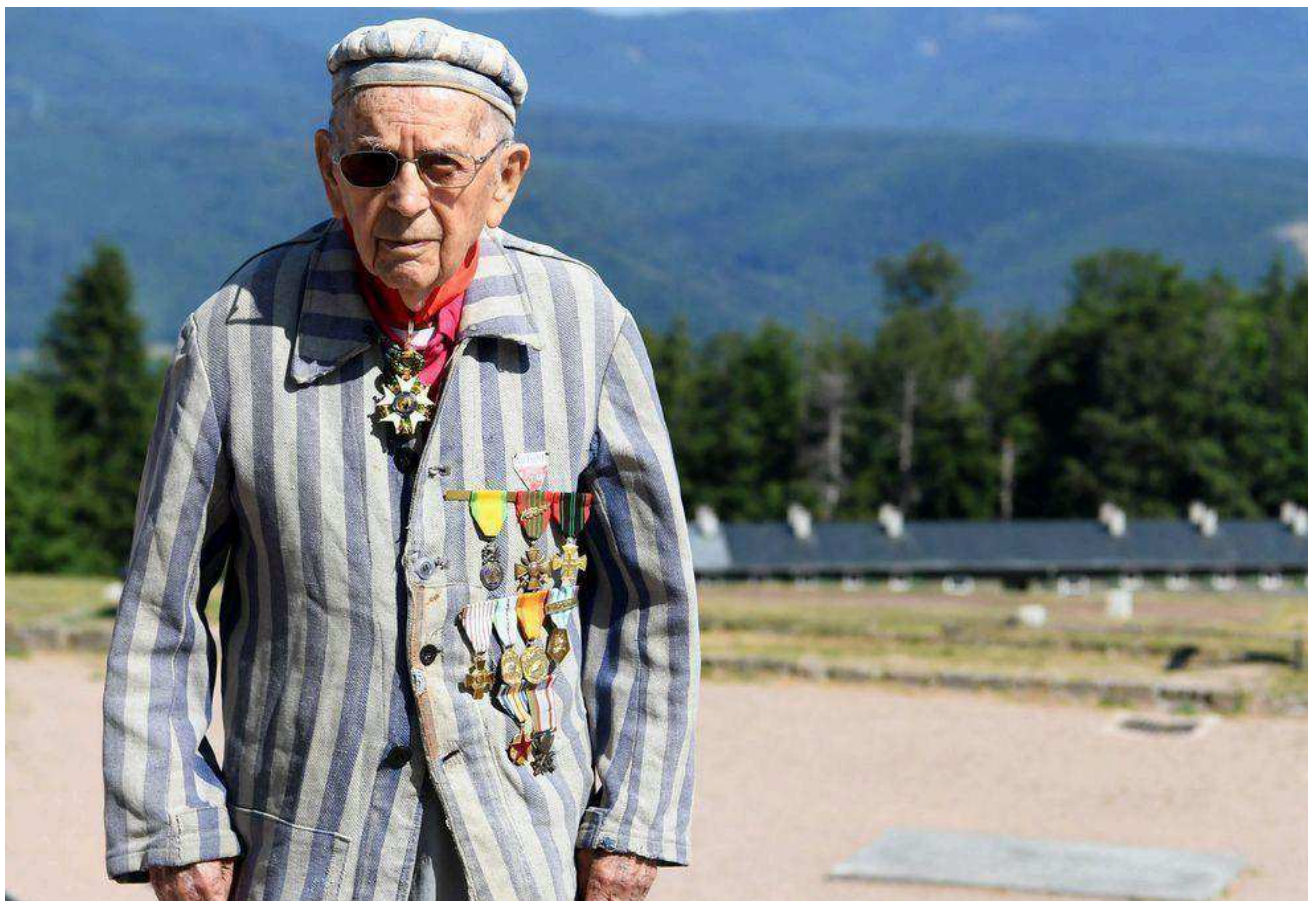
Jean Villeret en juin 2023 au camp du Struthof.