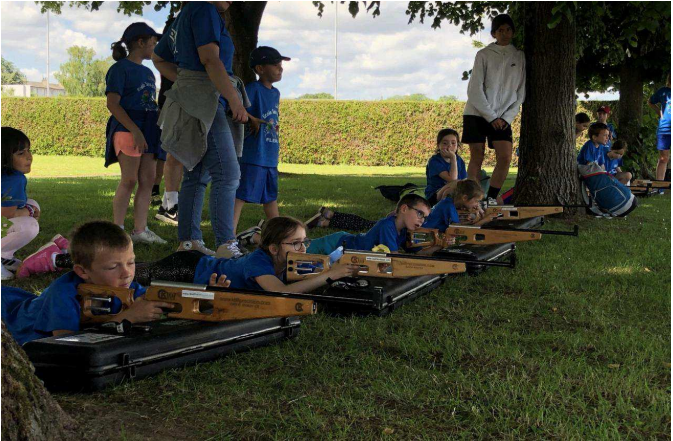
CP, CE1 et CE2 se sont relayés au tir de précision, animé par la fédération de biathlon.