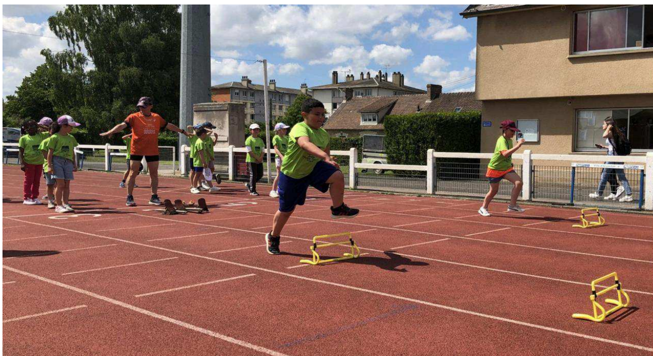
Les équipes, mixtes et de tous niveaux, se sont entraînées aux sports olympiques et paralympiques.