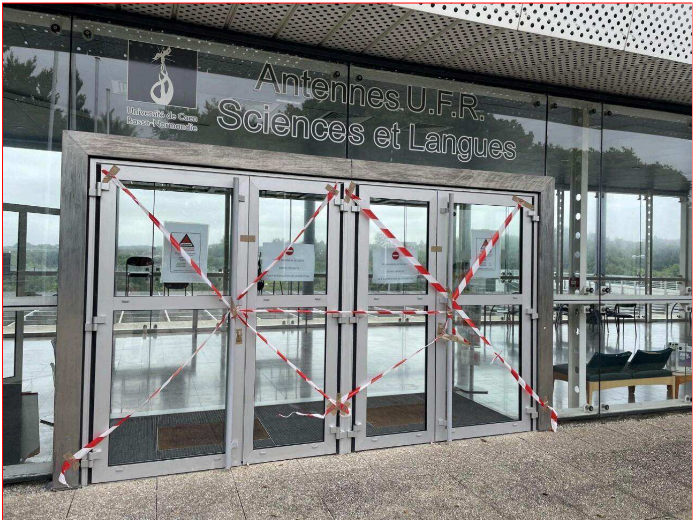
À Cherbourg (Manche), l'entrée de l'Esix et de l'UFR Sciences et Langues avait été interdite.