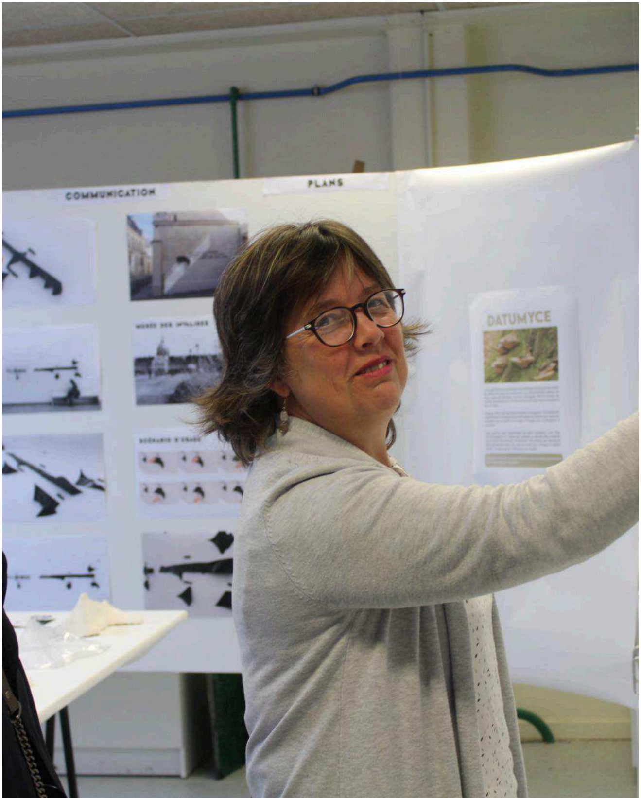
À la découverte des différents projets menés par les étudiants.