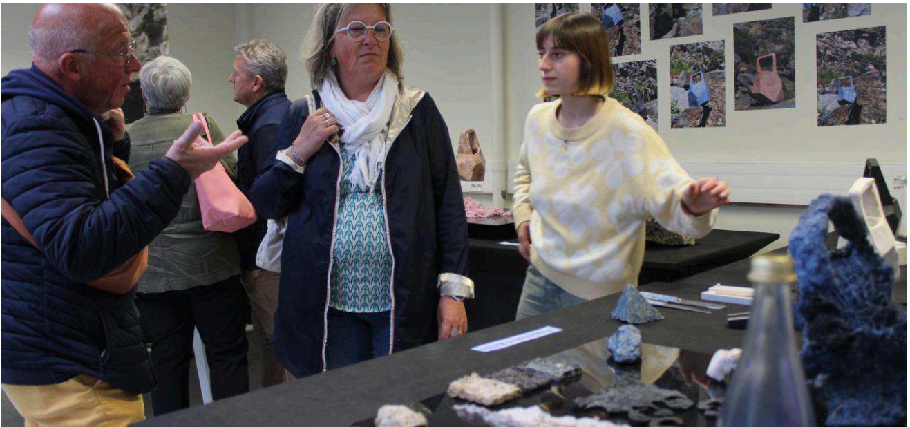
Les étudiants ont expliqué aux visiteurs leurs réalisations et projets.