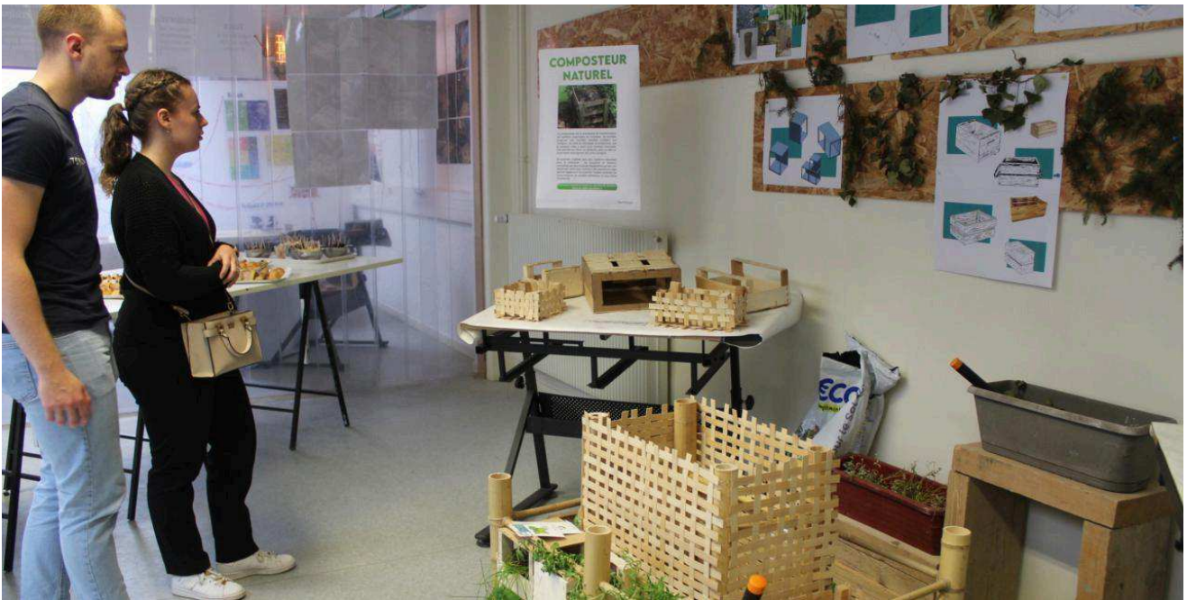
Un composteur réalisé par les étudiants.