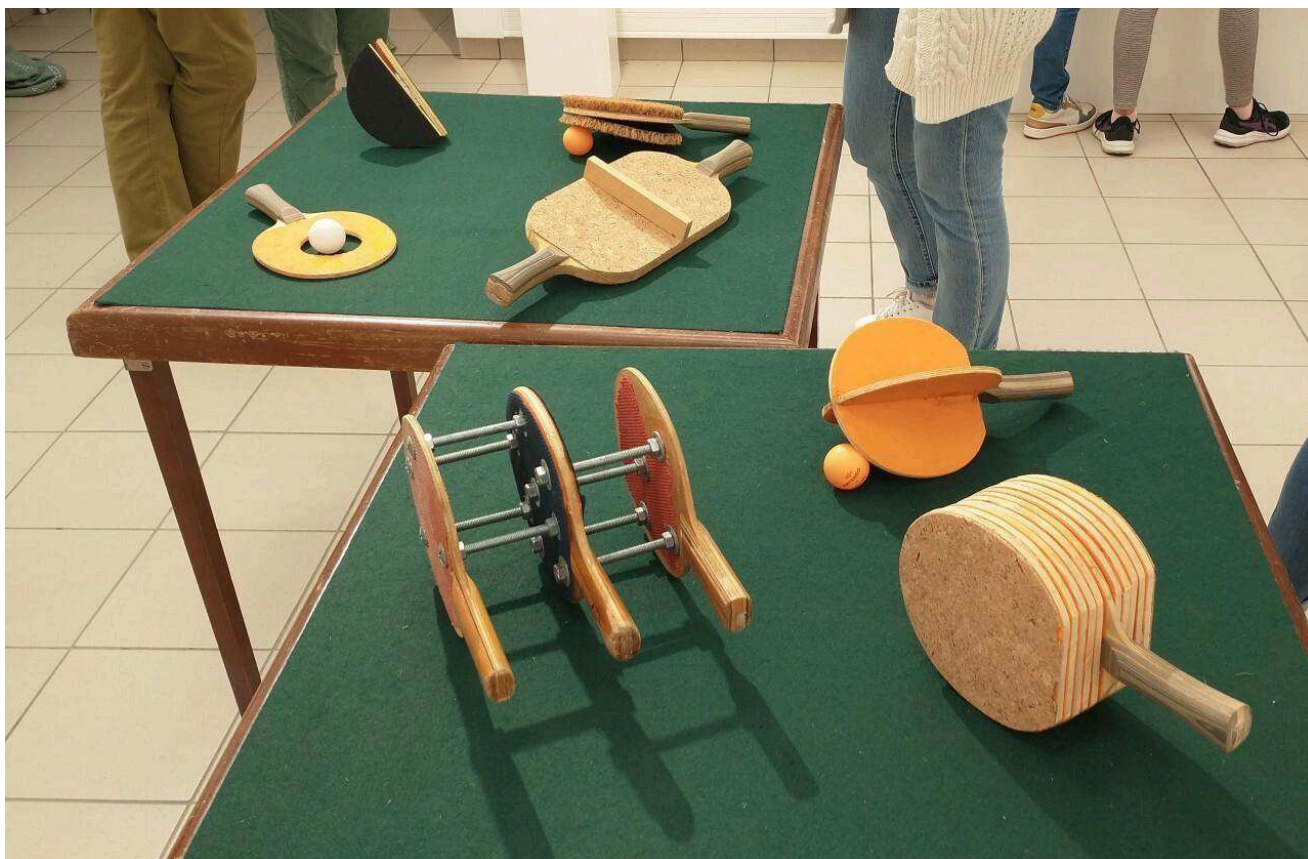
Des raquettes de tennis de table nouvelle version.

tions, des collages avec une notion de collision. Le but est de provoquer le petit flash de comment on va se servir de cet objet ? On pourrait même penser à une histoire pour s'en servir. Alexis Debeuf