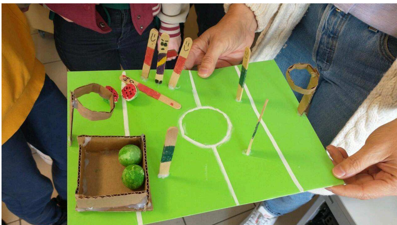
Un nouveau jeu : le lancer de pastèques.