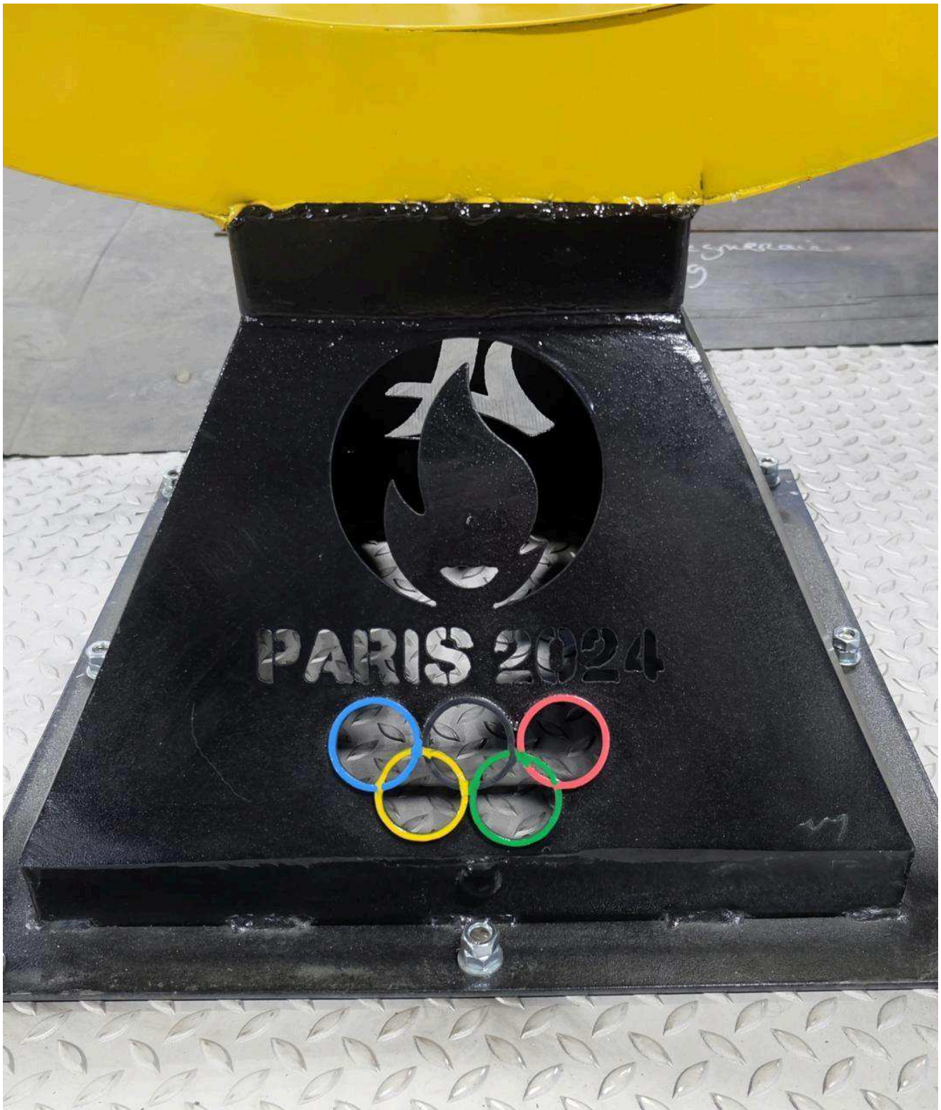
Le symbole olympique sur l'un des socles. Jocelyne Fréville-Vion