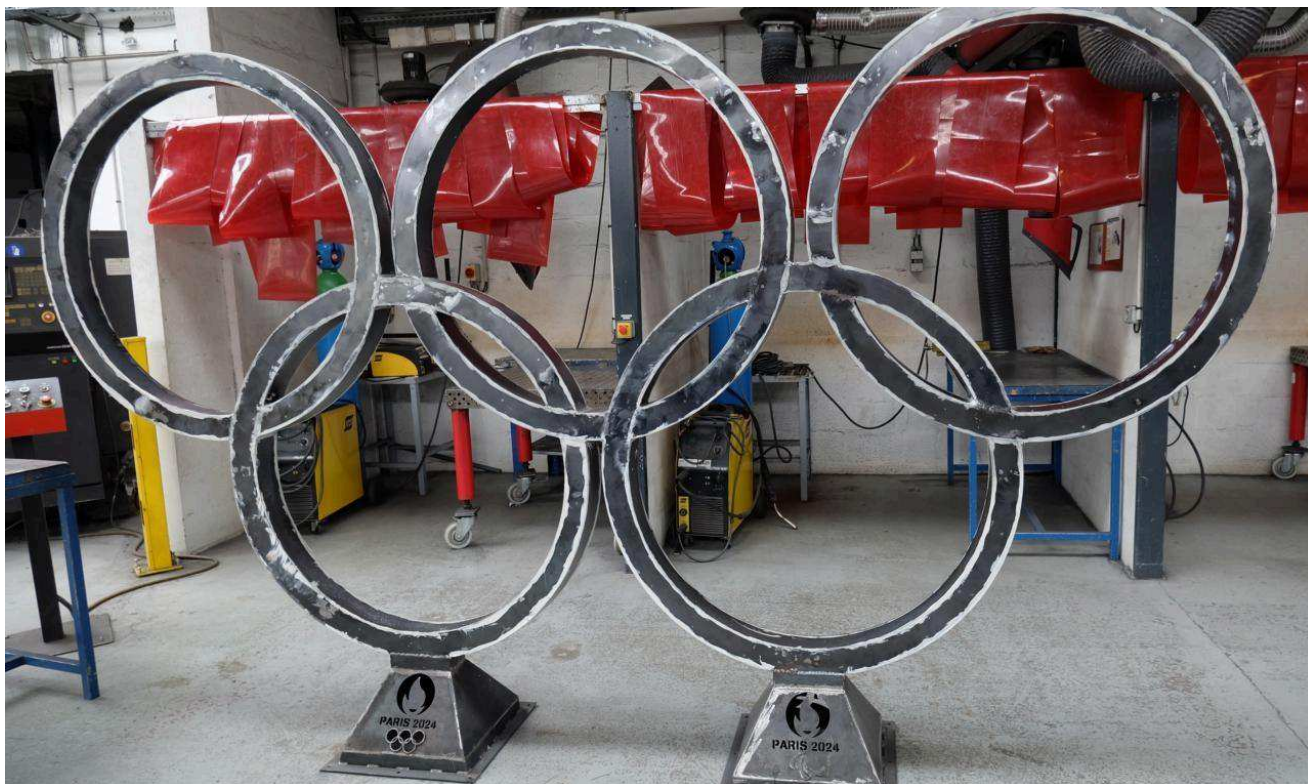
Les anneaux bruts. Le Bulletin