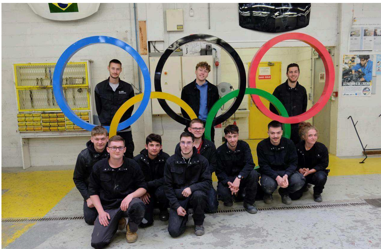
Les jeunes carrossiers-peintres ont donné de la couleur à l'ouvrage. Le Bulletin