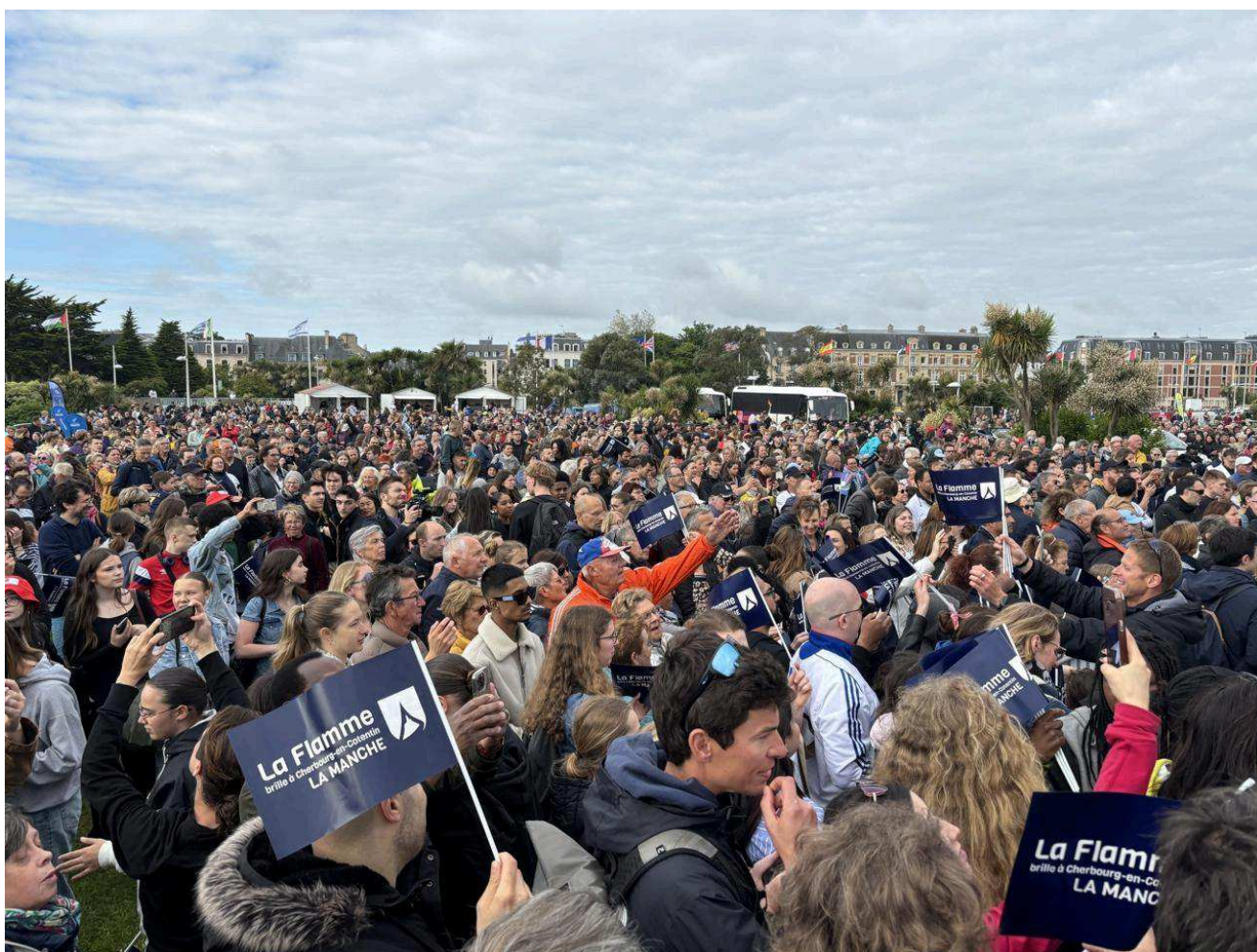
La plage verte de Cherbourg est noire de monde à l'arrivée de la flamme olympique. Ouest-France