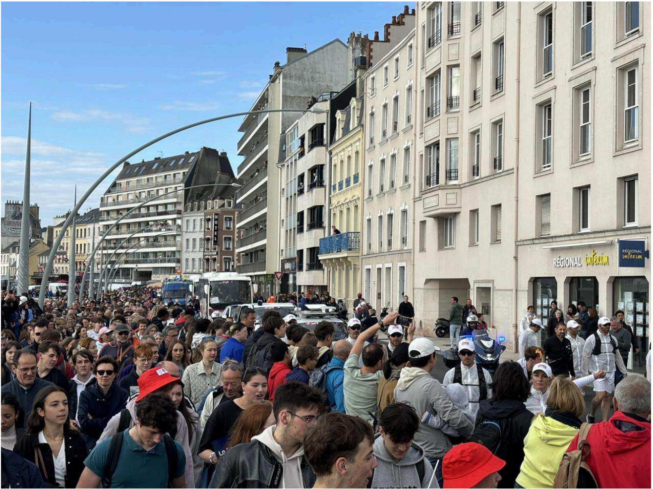
Le quai de Caligny ressemble à une véritable marée humaine pendant le passage de la flamme olympique.