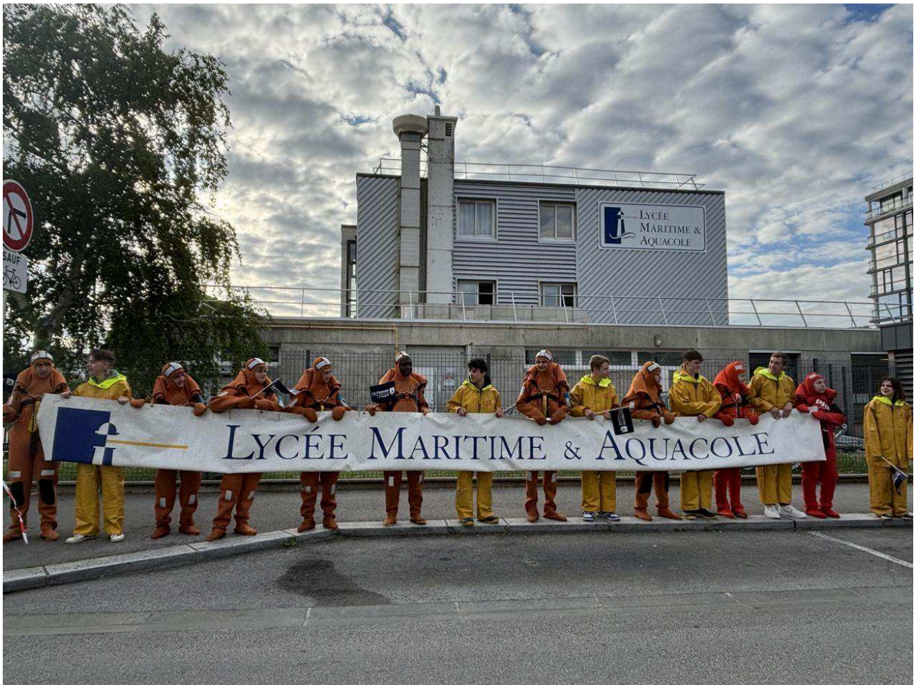
Les élèves du lycée maritime et aquacole attendent le passage de la flamme devant leur établissement. Ouest-France