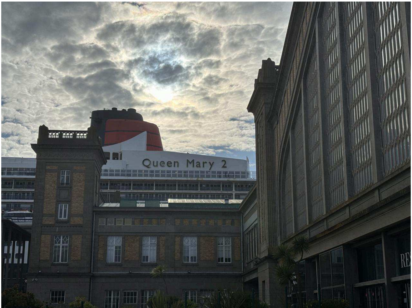
Le Queen Mary 2 est l'invitée surprise du passage de la flamme olympique à Cherbourg.